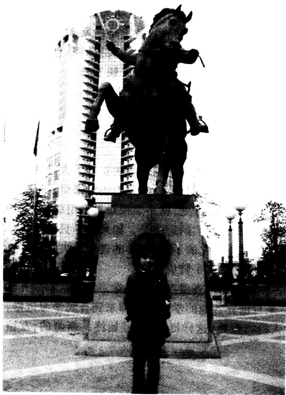
身后的大楼展示着莫斯科的未来

上了大巴大家都很兴奋，可惜天公不作美，又是那种莫斯科典型的阴沉沉的天气，估量着呆会得下雨。不过旅途终归还是愉快的。每车都配备了一名导游，一路驶去，我们的导游结合历史给我们一一介绍着，效果可一点不比上课差哦！第一站是麻雀山上的观礼台，曾经非常渴望站在这里俯瞰莫斯科城，可今天却是