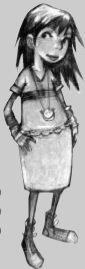
何 露 露

何露露——跣得连下巴都快顶到月亮上了，瞧不起任何人，幸好她爸爸不是天王老子，要不然其他同学可就惨啦！