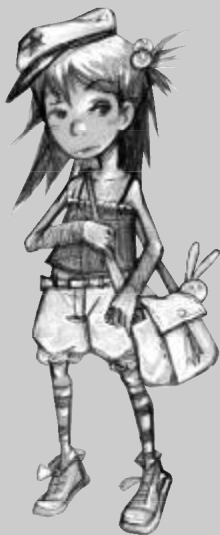
庄 晓 静

何露露——跣得连下巴都快顶到月亮上了，瞧不起任何人，幸好她爸爸不是天王老子，要不然其他同学可就惨啦！