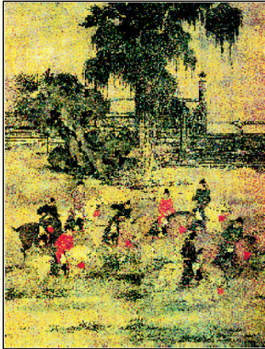
八达春游图 赵嘉 绢本设色 五代