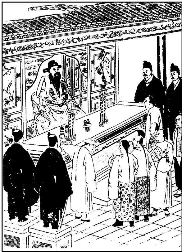
明政府企图羁縻努尔哈赤

是时努尔哈赤年方二十五岁，因祖、父二人往援古埒城，常着人探听消息。先接到明军撤围的音信，颇自安心，嗣后续闻警耗，至祖父被害一节，不觉大叫一声，晕倒在地。及众人救醒，放声大哭。连他伯叔兄弟，都各凄然。当下检查武库，只留遗甲十五副，一一携出，指示伯叔兄弟，提出复仇二字，哀恳臂助。那时伯叔兄弟，自然感愤得很，分着遗甲，一拥出城，向东而去。