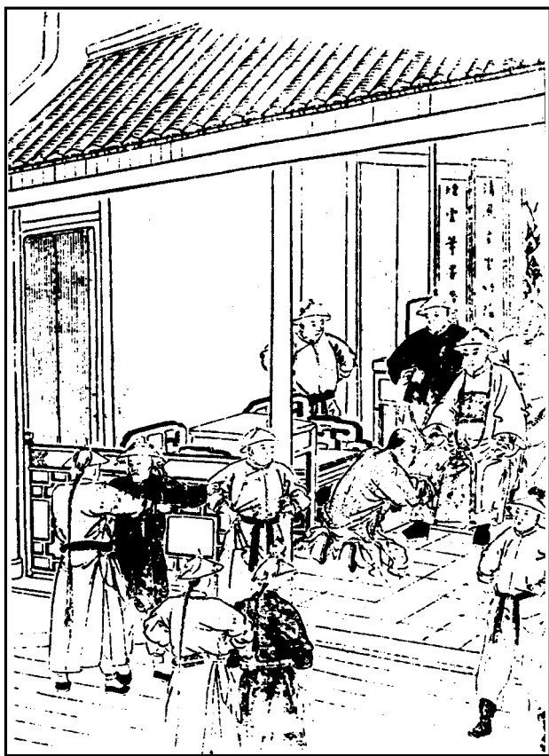
努尔哈赤召见范文程