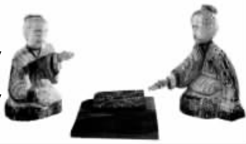
汉代人物木雕——六博图

日，太子入宫省疾，正值文帝痛血又流，便顾语太子道：“汝可为我吮去痛血！”太子闻命，不由得皱起眉头，欲想推辞，又觉得父命难违，没奈何屏着鼻息，向疮上吮了一口，慌忙吐去，已是不堪秽恶，几欲呕出宿食，勉强忍住。文帝瞧着太子形容，就长叹一声，叫他退去，仍召邓通入吮余血。通照常吮吸，一些儿没有难色，益使文帝心为感动，宠昵愈甚。惟太子回到东宫，尚觉恶心，暗思吮痛一事，是由何人作俑，却使我也去承当？随即密嘱近臣，仔细探听。旋得复报，乃是邓通常入宫吮痛，免不得又愧又恨。嗣是与邓通结成嫌隙，待时报复，事见后文。