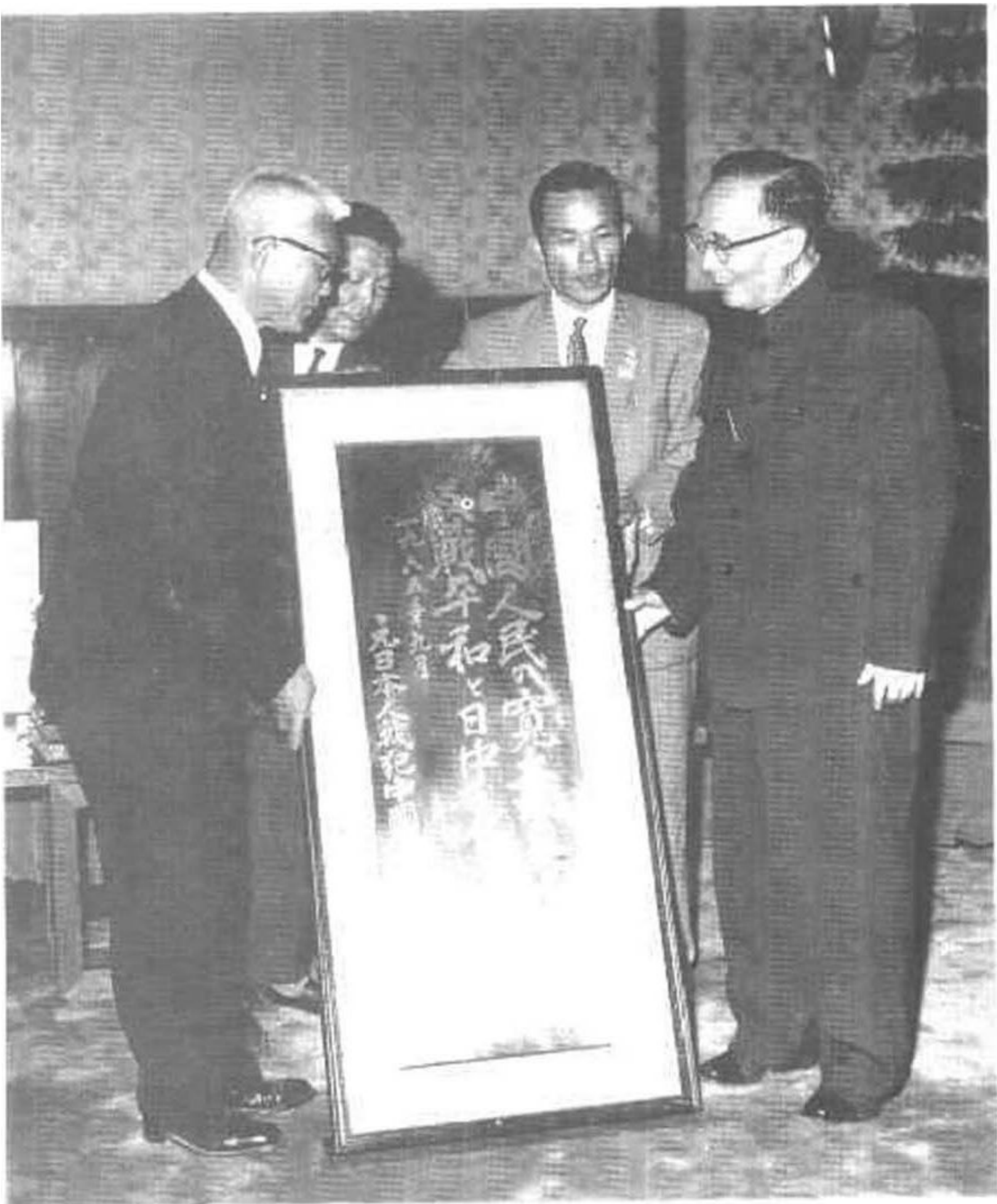
一九六五年九月二十九日晚中日友好协会名誉会长郭沫若会见 中归联 首次访华团时接受赠匾。