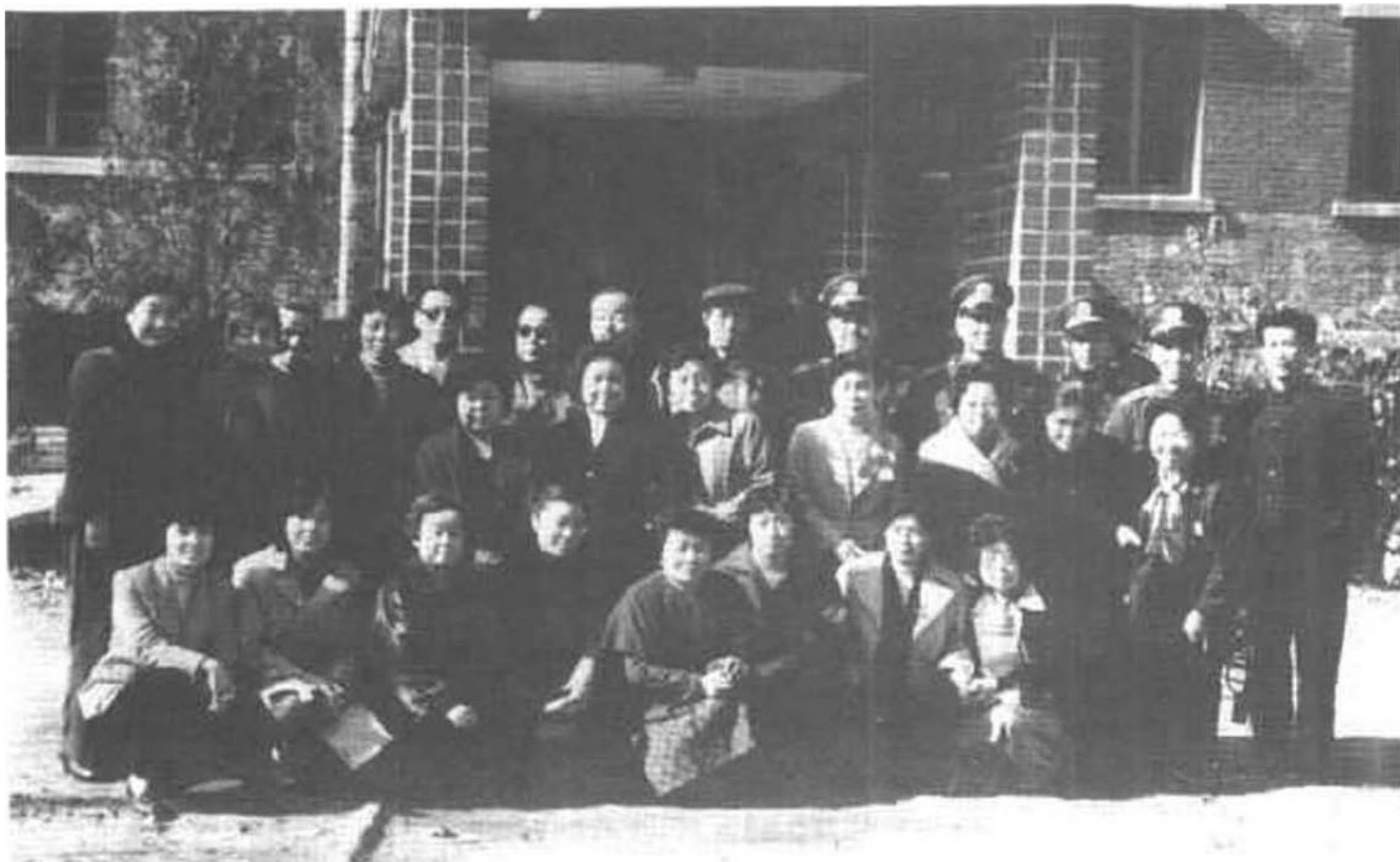
1985年10月17日，“中归联”夫人访华团一行到其丈夫及亲人曾被管押过的抚顺战犯管理所参观，并同该所工作人员合影。