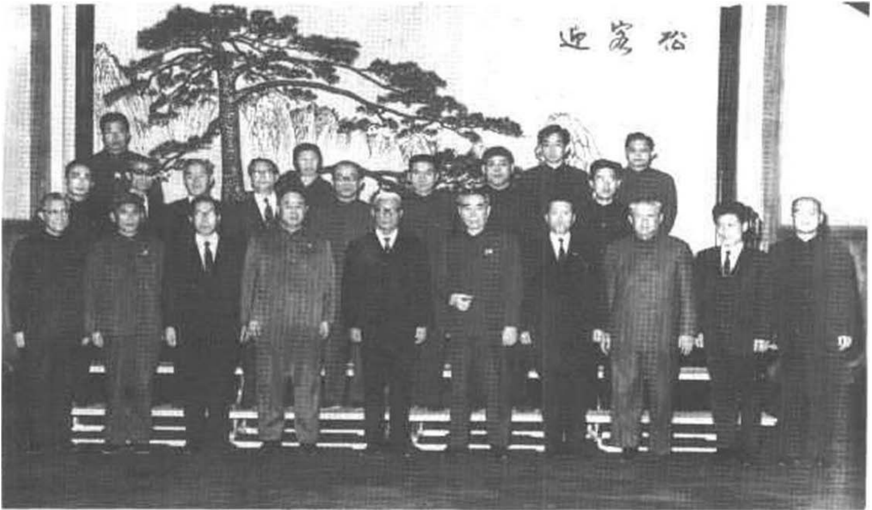
1972年11月9日下午，周总理等会见“中归联”第二次访华团时，同访华团全体成员合影。