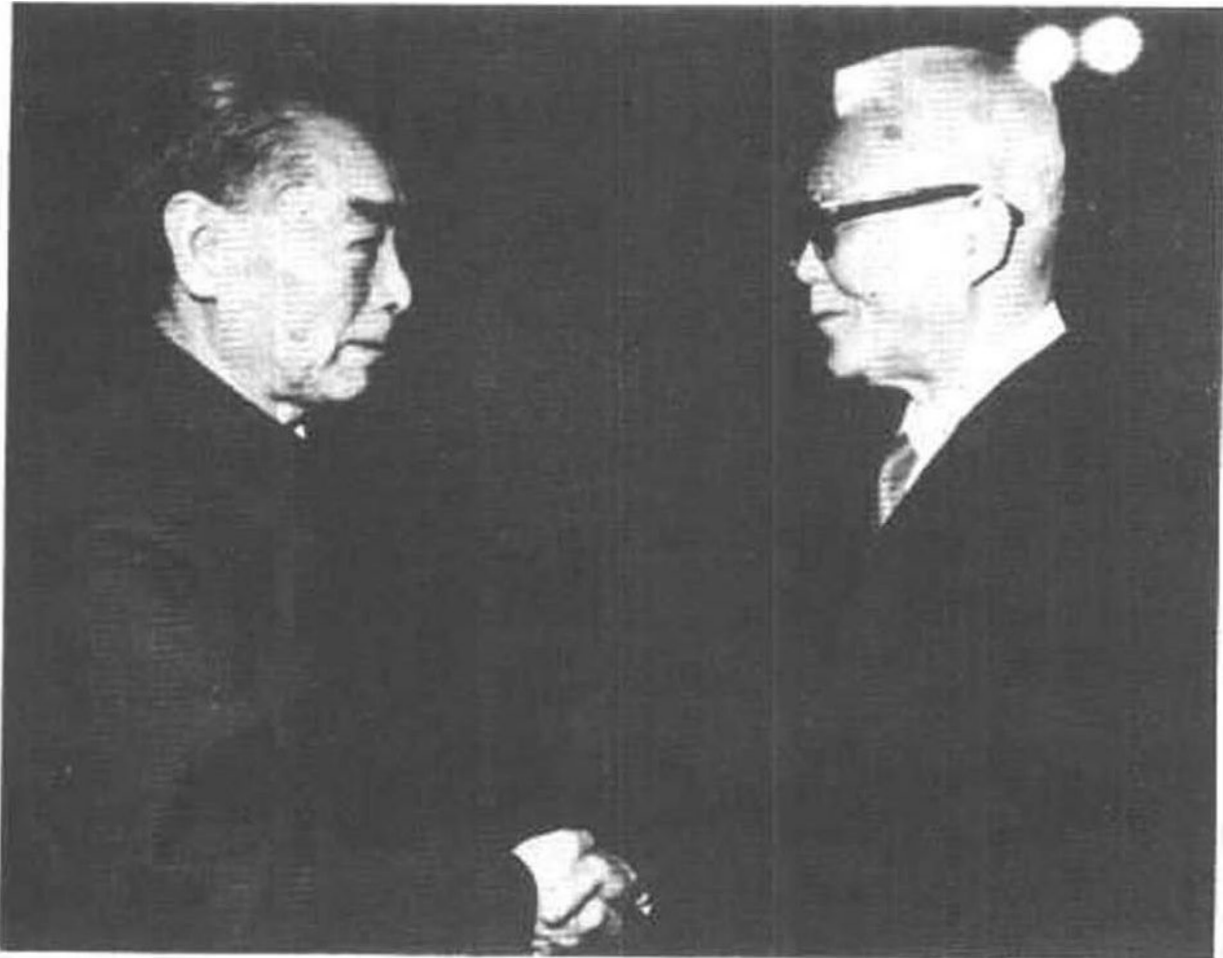
1972年11月9日下午，周总理在人民大会堂会见“中归联”第二次访华团时，同藤田茂会长握手。