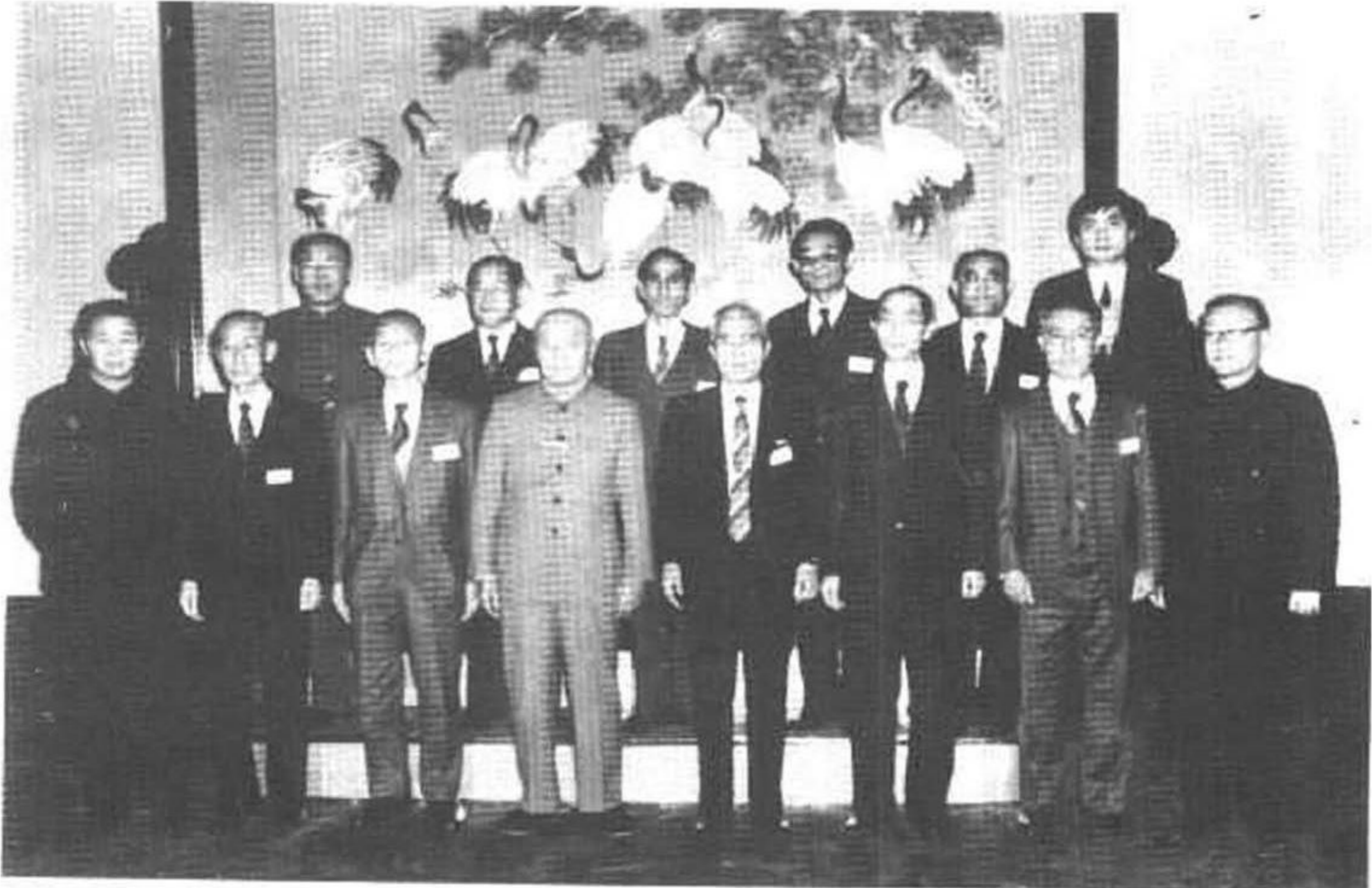
1986年11月19日，全国政协副主席吕正操等在人民大会堂会见“统一中归联”访华团时，同富永正三、大河原孝一等全体成员合影。