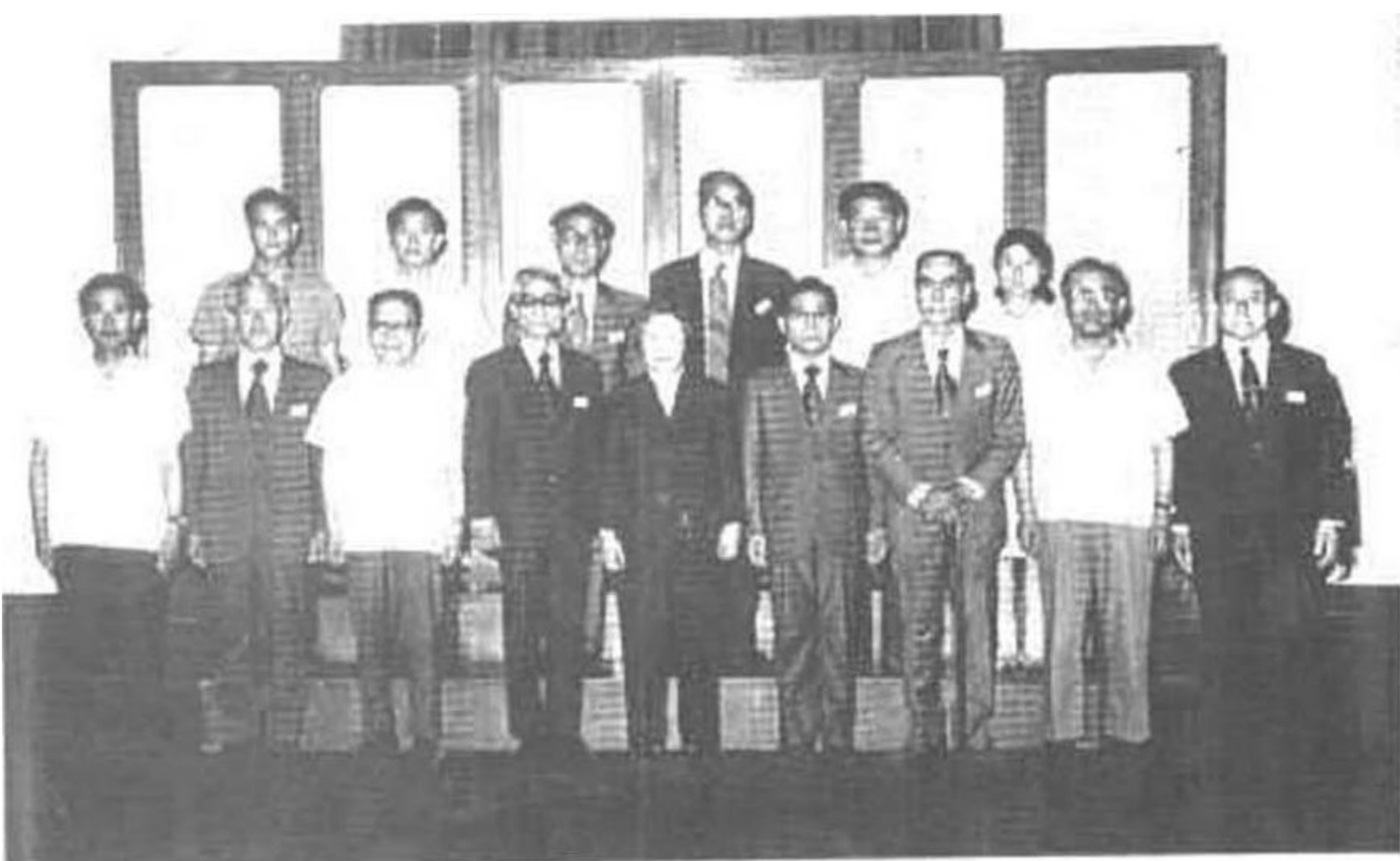
一九七八年七月，邓颖超副委员 长等在人民大会堂会见 中归联 第 五次访华团时合影。