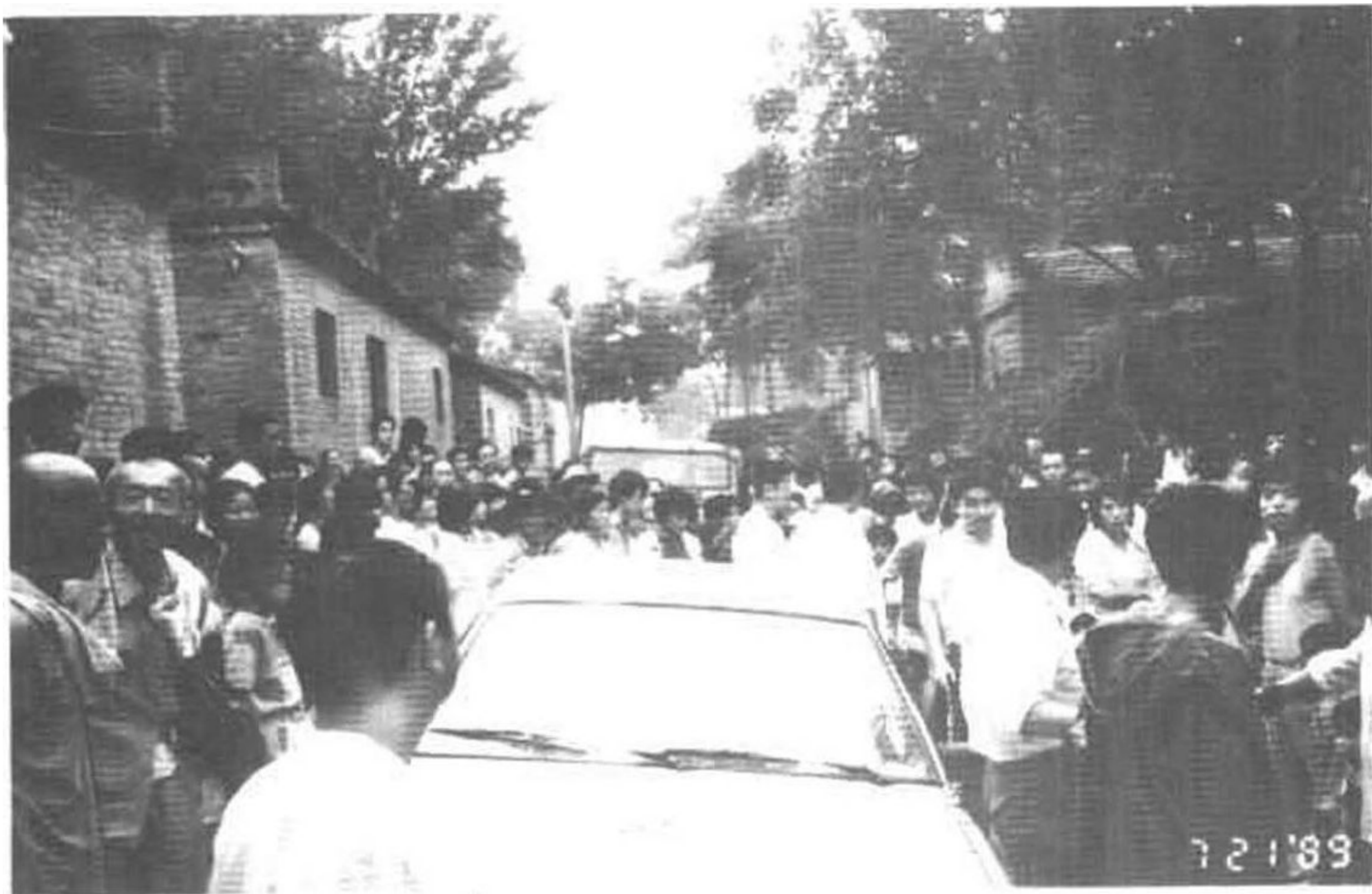
1989年7月，“中归联”同日本广播协会“NHK”电视台采访组到日军当年犯罪的山东省临清县吴寨采访时的情景。