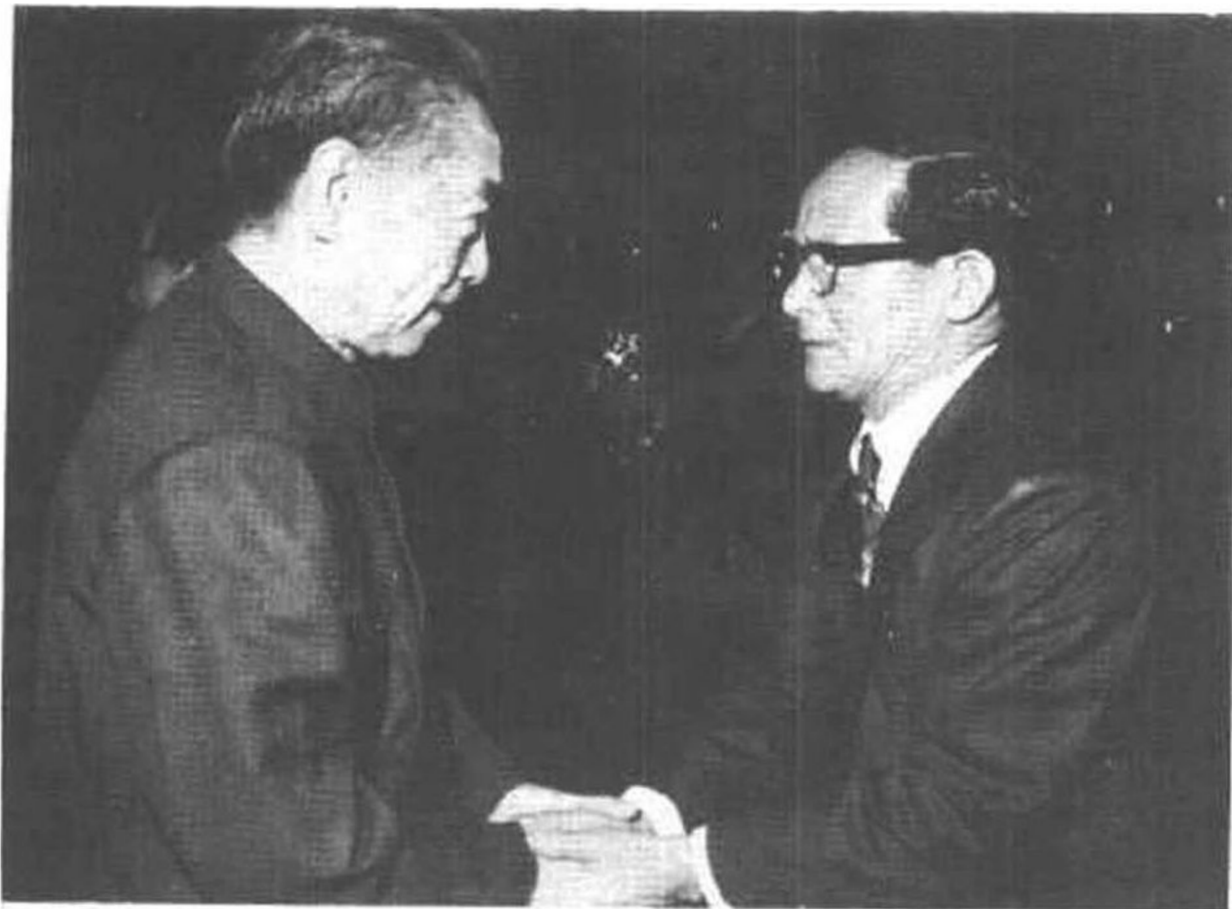
周总理同“中归联”常务委员兼东京支部长三尾丰握手。