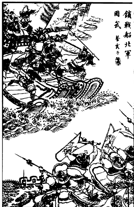
鎖戰船北軍 用武 卷之三