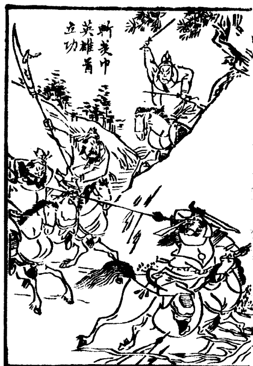
斩黄巾英雄首立功

在穷人眼里，一穗麦子胜似一条黄金。她捡着这一穗，望着那一穗，过了这块田，又到那块田，不知不觉到了日头偏西，才忽然想起了树底下的孩子。“啊呀，天哪天，当顶的日头，岂不把他晒