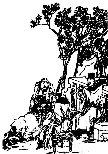
桃园三结义 《三国演义》古版刻本插图

一天，从西面来了一位肩挑小商，是卖绿豆的。这人行至张飞店前，似觉口渴。猛然间，他看见那边有口井，顿时喜出望外。他走上前去，想打点水，可是一看，井口上盖着一块厚厚的大石板。他奇怪之余，一手把那块石板掀了起来，挪到一边。再往下看，哟，井筒里挂满整块整块的生猪鲜肉。他有点扫兴，