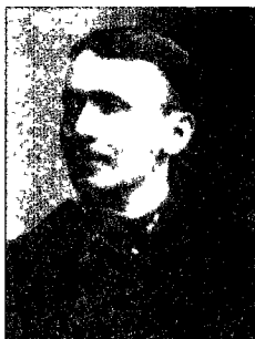
斯坦因服役期间 (1886年)