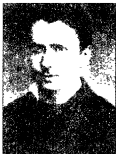
在蒂宾根上学时的斯坦因