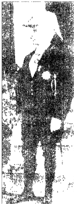
斯坦因身穿出席授勋仪式的礼服