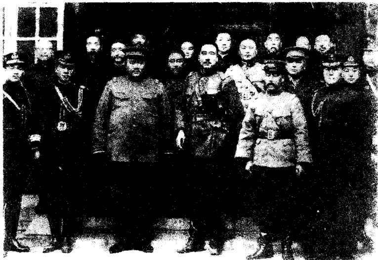
直皖大战中获胜的联军将领合影