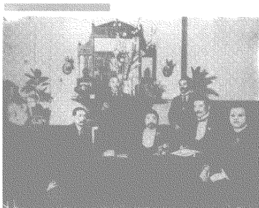
孙中山在上海与黄兴等人合影