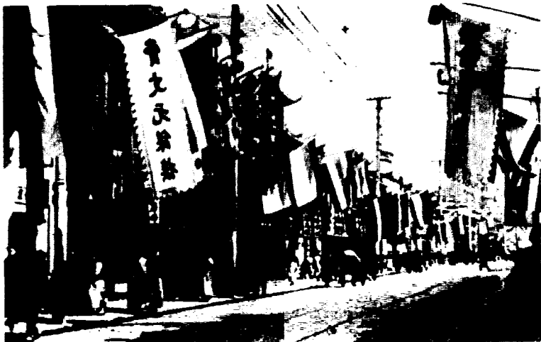
上海南京路各商家庆祝南京临时政府成立情形

昨日为补祝中华民国元年元旦之期，本城大东门、小东门、新老北门内各商店皆一律挂灯悬旗庆贺，其尤开通之各商店更皆闭门停止办公，在城各社会团体门前亦皆扎有冬青柏枝“共和万岁”、“民国万岁”，悬灯结彩，沪军都督府署前除头门扎成“共和万岁”，仪门扎“总统万岁”电灯，