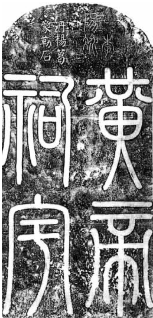
“黄帝祠宇”碑 ◎唐·李阳冰 题

李阳冰 唐代文字学家、书法家。字少温，赵郡（今河北赵县）人，李白族叔。唐乾元间任浙江缙云县令，后官至将作监。曾编李白诗集《草堂集》并为序。李阳冰以篆学名世，其小篆圆淳瘦劲，时人谓之笔虎，被誉为李斯后小篆第一人，后世学篆者多宗之。缙云所留李阳冰石刻多处。《黄帝祠宇》碑现存缙云博物馆。石碑（长×宽×厚）：195cm×100cm×20cm，碑头右为“李阳冰”三字，左边“丹杨葛蒙勒石”六字为颜真卿书。