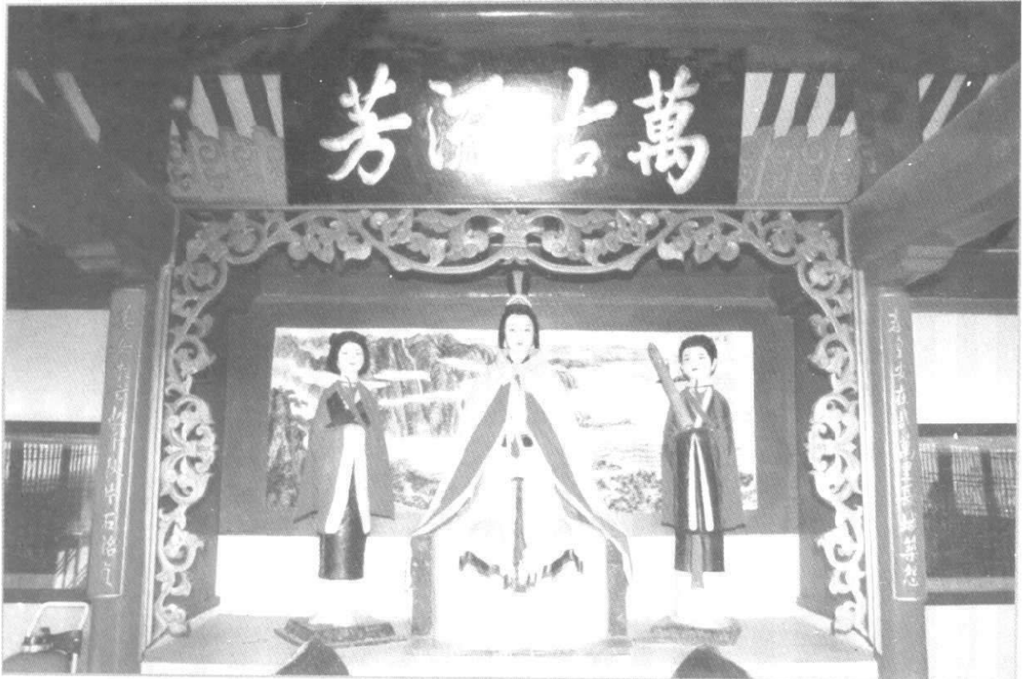
贞女祠中的孟姜女塑像