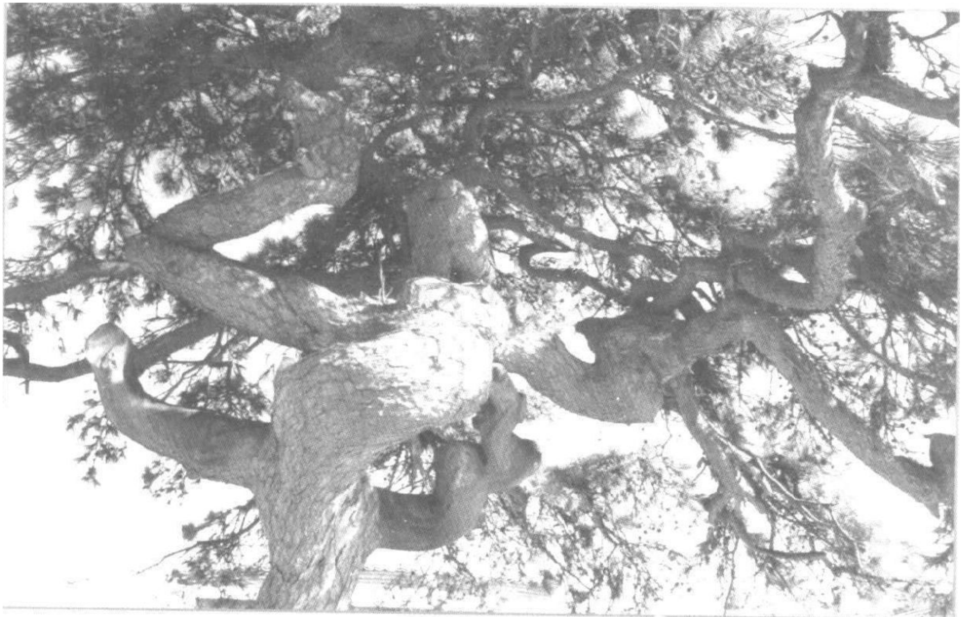
三清观中的蟠龙松