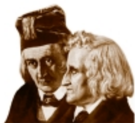
Jacob Grimm & Wilhelm Grimm