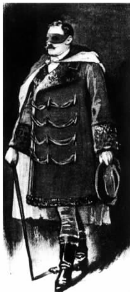
他的衣着充满富豪之气