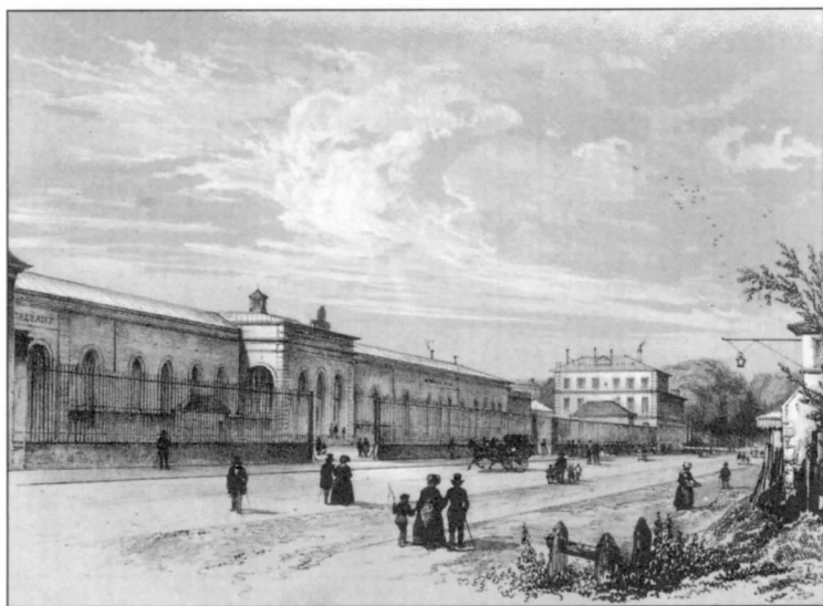
马车把他送至奥尔良火车站。

雅克一点也没犹豫,他只想快快离开巴黎,离开它那沉闷的空气、那充满氨臭的氛围、那些刚落成的公园广场和交易所大楼四周新栽下的原始林木,以及长年不休地活跃在交易所里追随实力强大的银行家皇帝的“忠臣”们。