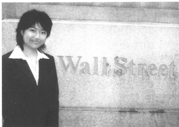
初次访问华尔街，她已经感受到投资大师们的强悍。