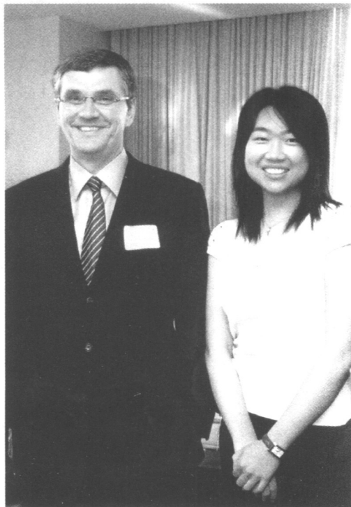
与道明银行证券公司总裁兼最高执行官道仁斯先生一起出席招待会