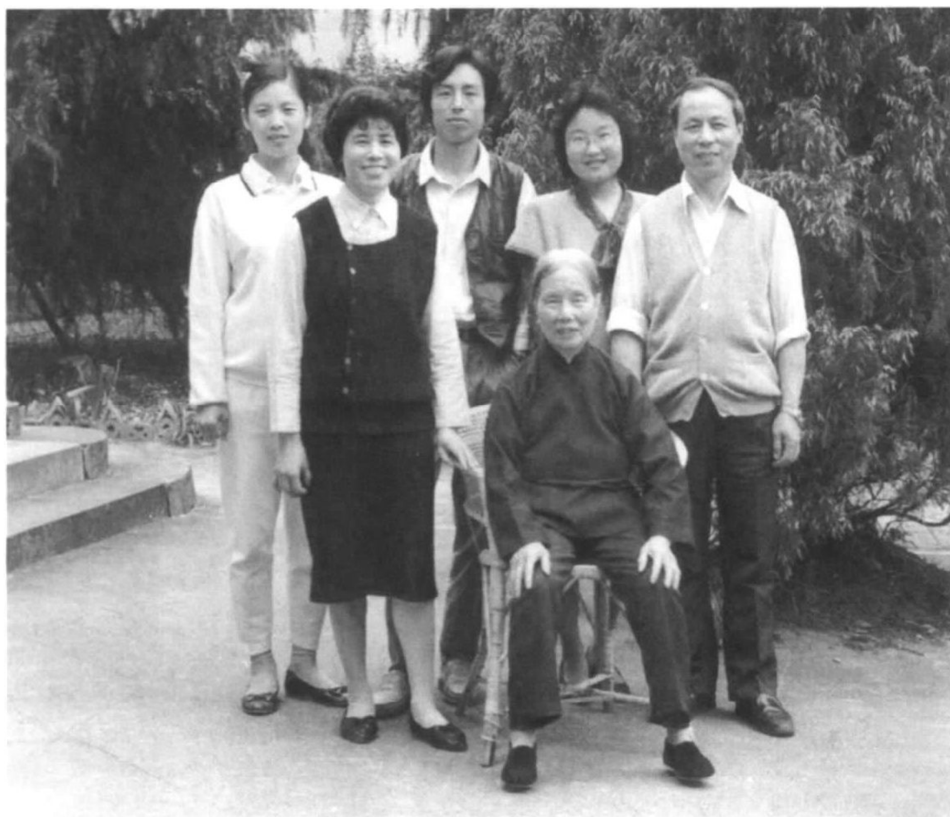
1996年《今日中国》随文刊发的全家福