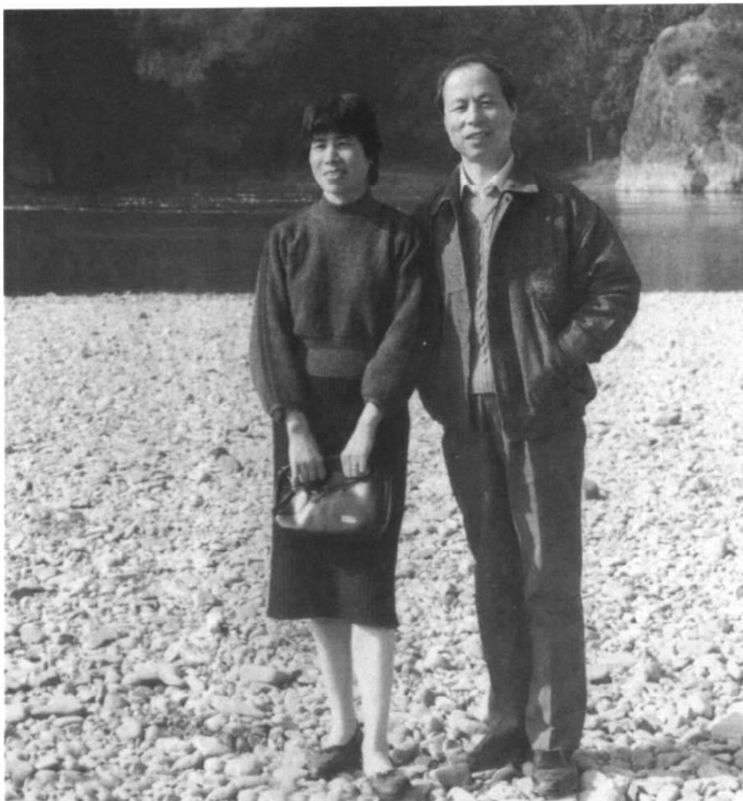
1991年和患难与共的妻子于石门洞江边