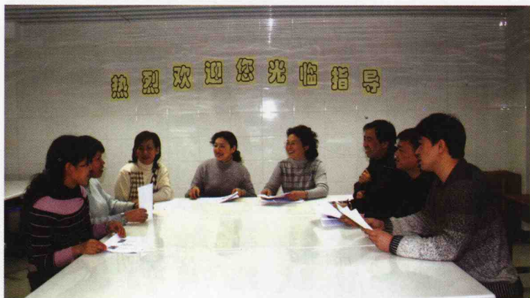
编委会成员正在热烈的讨论