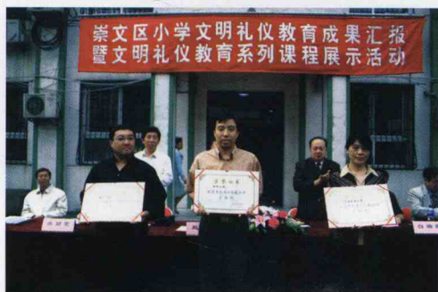
崇文区教委向实验课学校崇文区回民小学、金台小学、天坛东里小学颁发证书