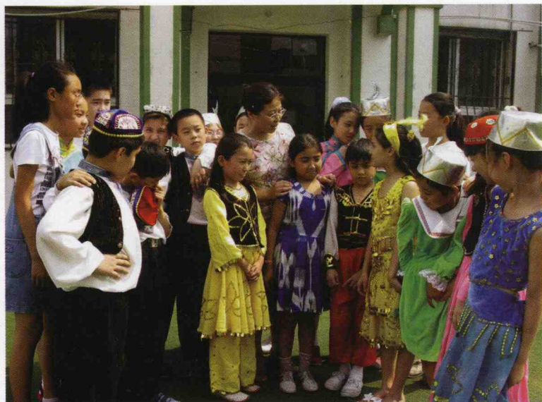
回民小学盛开民族之花，近10个民族的儿童在这里学习