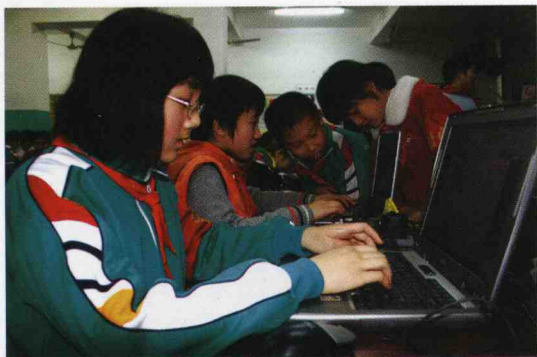
学生使用笔记本电脑参与学写藏头诗