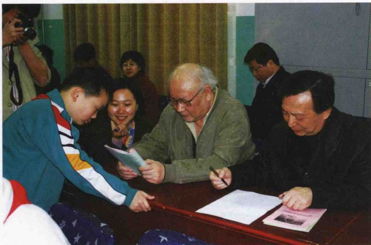
著名作家赵大年、民俗专家赵书在课堂上亲自指导学生写藏头诗