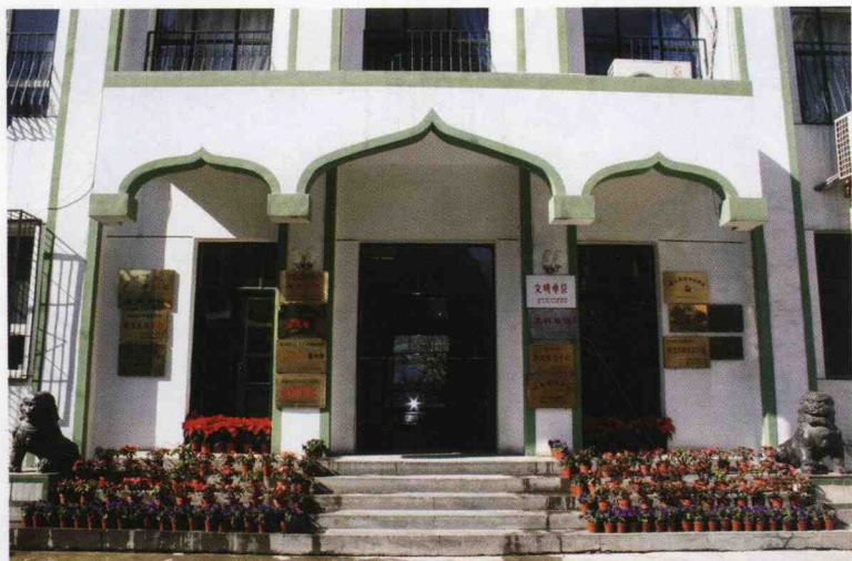
崇文区回民小学校门临街风貌