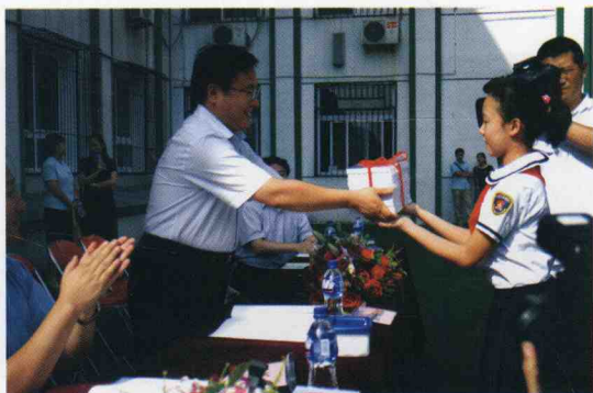
北京市教工委刘宇辉委员在向小学生赠送《小学生日常行为规范解读》光盘