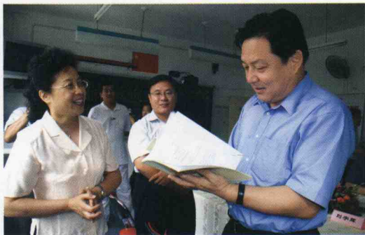
中共北京市委市委常委、组织部部长赵家骐到校指导编写《学写藏头诗》校本教材