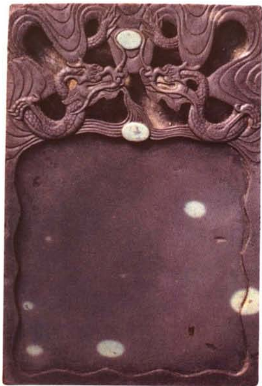
古苴却双龙戏珠砚

回到村里，倪姓书生带领家人取石制砚，始成为创制苴却砚的开山鼻祖。历经几代人艰辛求索，苴却砚的生产由开初的倪氏一门，发展到了依沙拉、大保哨及裕民街十余家制砚作坊。