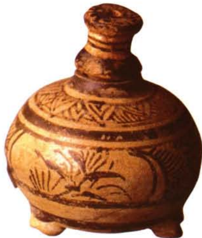
彩绘三足罐形砚滴

青花绿绿膘：平地坑石。绿膘色泽以翠绿居多，所不同的是其中伴有青花花纹。有的如冬日积雪，有的如细雨微尘，有的如玉树琼林，有的如秋山密林。青花绿绿膘同样得天公造化，为膘石中独具特色的名品。