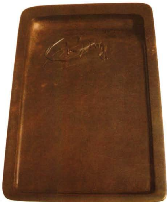
紫白石老人肖像砚

石形分人工石形与天然石形。好的人工石形，应是经过人为的精挑细选，去除毛石粗劣的部分，取其精华，然后根据美的规律完成造型。如我们常见的传统砚式中的长方、四直形、凤池、抄手等，这些砚的长、宽、厚度均有严谨讲究的比例，是千百年来经过不断的修饰完善而相对确立下来的砚形。天然石形是正反两面相对平整，石形边沿凹凸不多，形态无琐碎、无呆滞感、不带刀边斜口的原生料石。