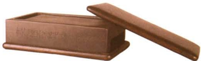
天地盖端石抄手砚