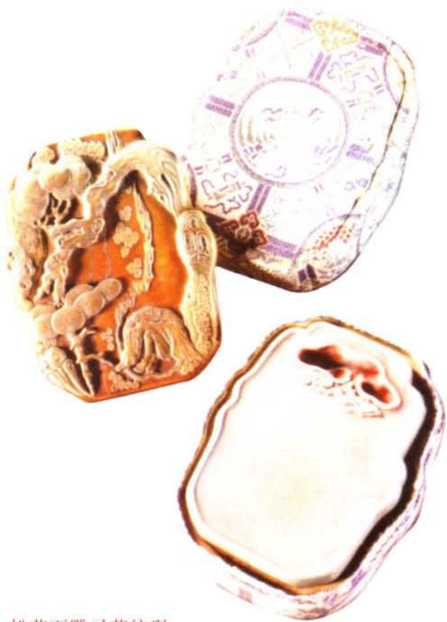
松花石雕灵芝纹砚