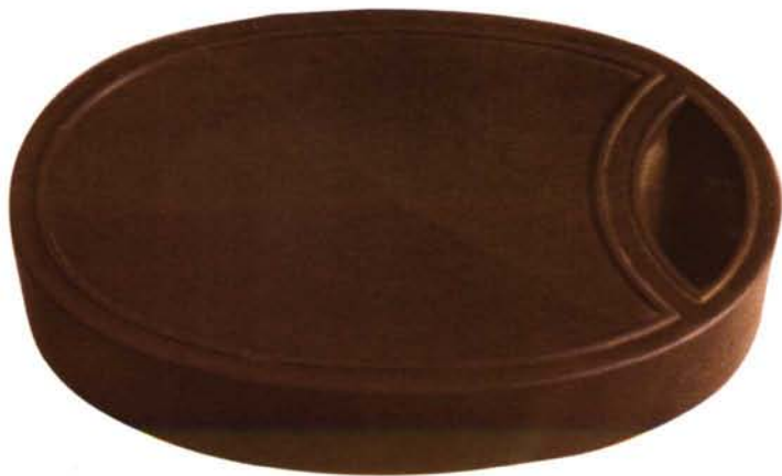
仿汉未央砖海天初月砚

苴却毛石的颜色为淡紫黑色，摩氏硬度在3-3.5度之间。从毛石颜色的深浅上，一般能看出石质的软硬程度。如硬度偏高的砚石，色泽多为偏黑，视觉偏于沉重一类。而色泽向淡偏白的料石，石质则较为偏软。苴却石的黄黧、绿黧石较多。从黄、绿黧石的颜色表现上同样可以进行鉴别。如黄色黧石、黄绿色、翠绿色和桔黄色、淡黄色黧石，前者硬度较之后者硬度普遍要低一些。绿色黧石中，深绿色、墨绿色与翠绿色，其石质较之粉绿色、淡黄色与淡绿色料石，硬度则普遍要高一些。砚料上天然伴生