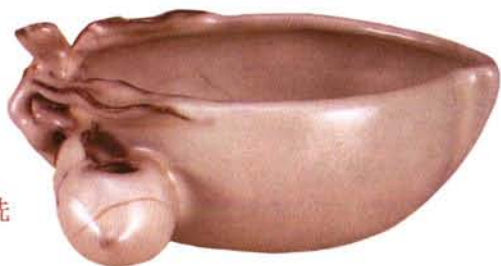
景德镇仿官窑桃式洗

笔的装饰在笔管，笔毫易损，可以经常替换，而称心如意的笔管可以长久把玩。从运笔的效果而言，笔管宜轻便，但是我们看到古代毛笔的笔管有金、银、玉、象牙、水晶等各种珍贵的材料，并在笔管上巧加雕琢，还有镶嵌螺钿等，显示了这类笔与实用无关、玩赏至上的装饰趣味。