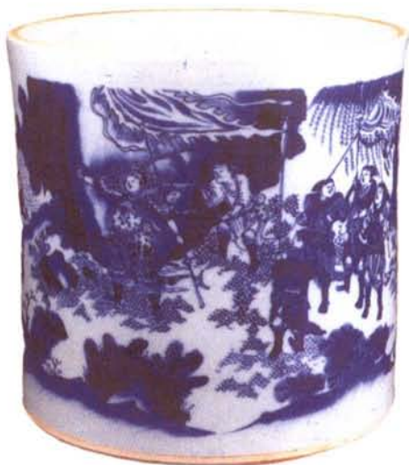
青花山水人物笔筒

四宝品类繁多，丰富多彩，名品名师，见诸载籍。四宝尤以湖笔、端砚、徽墨、宣纸著称，至今仍享有盛名。