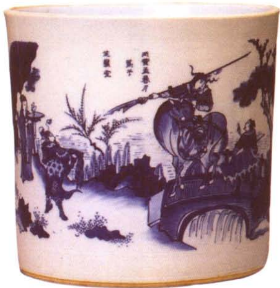
青花三国人物故事图笔筒

文房用具是多种有关书写的器具的总称，其中以文房四宝——笔、墨、纸、砚为主要用具。在中华民族文化发展史上立下了不朽的功勋，它具有优良的民族文化和独特的艺术风格。几千年来，它对记录祖国悠久的历史，传播文化知识以及促进书法、绘画艺术的发展，都起到了重要作用。同时对促进世界文明和社会进步也做出了巨大贡献。这些文书工具本身由于应用而产生，并在不断的改进和提高中，发展成为我国独具特色的工艺美术品。