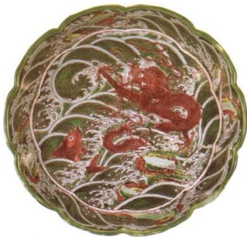
素三彩海水鱼龙十棱洗

说到古代文人的艺术情趣，人们总是首先会想起文人画。不可否认，文人画的确是古代充满着睿智和才华的群体，同时一个个又是浪漫而又情感丰富的性情中人。除了绘画之外，品茶赏花，奏琴弈棋，饮酒赋诗等，也是他们生活的一部分。文人在濡笔运墨之余，也把闲情逸致的余韵散发到写诗作画的工具上，对实用性的文房用具摩挲审视，并以宝爱赏玩的态度对待之。他们甚至还常常参与文房用品的设计，