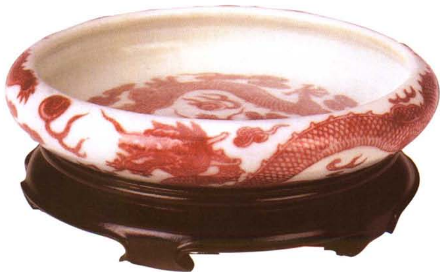
釉里红赶珠龙纹水洗

文房四宝不仅有实用价值，更重要的是它成为融汇绘画、书法、雕刻、装饰等各种艺术特色为一体的综合艺术品。