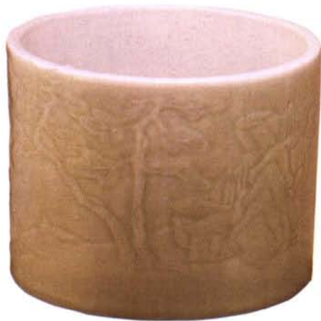
豆青釉浮雕山水大笔筒