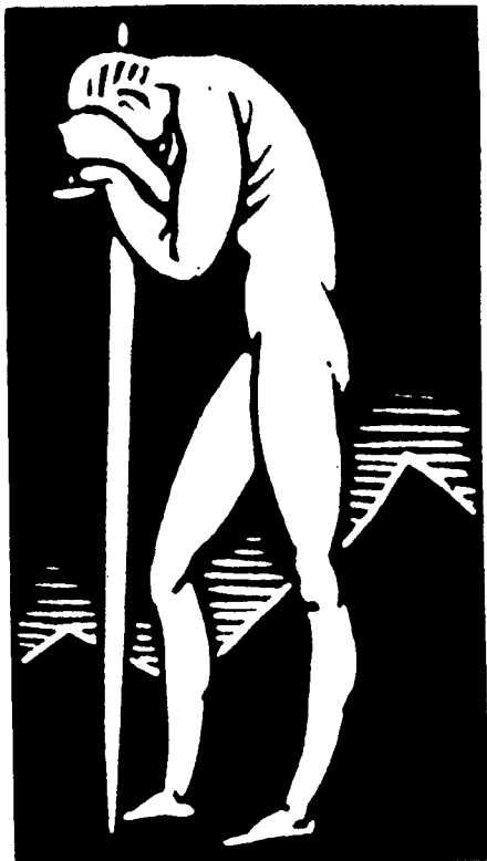
倚剑的男人 [美国] 肯特 / 图