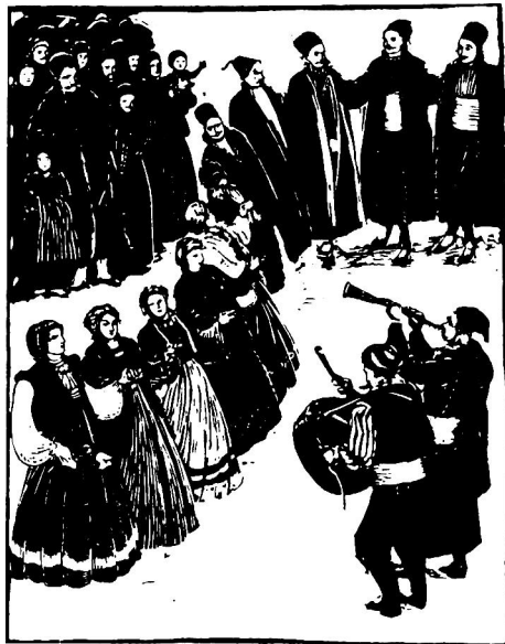
霍罗舞 [保加利亚]查·袁契夫/图

埃及曾是早期希腊天才荷马、伊索和希罗多德的圣地。然而人们知道罗马是希腊的翻版，却不知道埃及是希腊的蓝本。比如向俄狄浦斯提问的那个斯芬克斯就原产于埃及。它的化身之一狮身人面像，现在还在大金字塔脚下。可惜奥斯曼帝国的炮兵曾把它当做靶子，把它的鼻子轰没了。说到鼻子，自然容易想到托勒密王朝的克丽奥帕特拉。但不必相信帕斯卡尔关于“如果克丽奥帕特