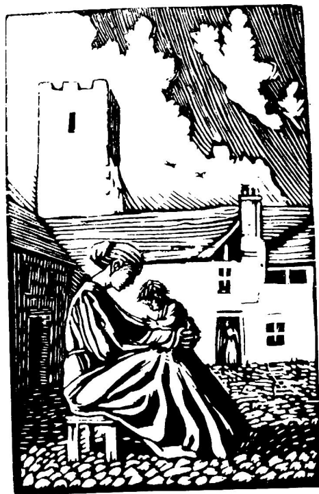
院 [ 英国 ] 格·拉弗雷 / 图

毕竟曾是大英帝国，英伦三岛的贵族气息犹浓。英国现在还保留着爵士封号，除了世袭的贵族，各个行业中拔尖的人物也可能成为爵士。有教养的英国人