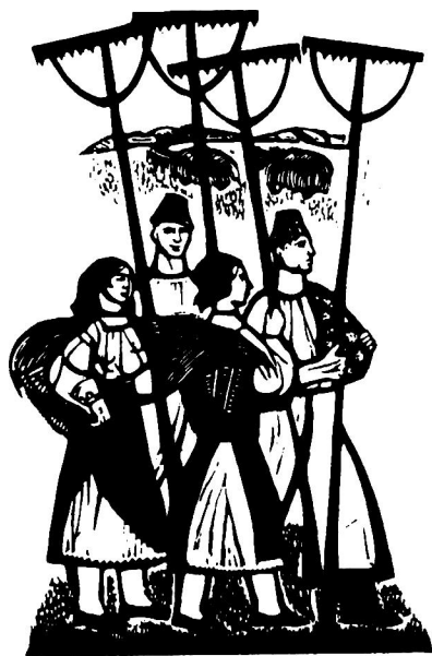
劳动归来柯·达妮特/图

以前定义美国的性格似乎很难，但最近渐渐简单起来。它是从欧洲各个国家的移民带来的各自血统的一种融合。但是由于贩卖黑奴等等不光彩的历史，美国的文化也混合了从非洲而来的倔强的黑人文化，包括了他们的教育模式、生活习惯甚至道德观念。在那里，行为规范被制定成为所有这些文化的最小公分母，即全部的吸收。但由于过于强调文化的多样性，美国的个性也正在受到侵蚀，因为不断从世界各地涌入的移民还在不断改变这个国家的性格。虽然这种包容看起来十分的诱人，但是知识分子的文化与工人、农民与商人的文化相差越来越大，这也被看成是东海岸的IT精英们和