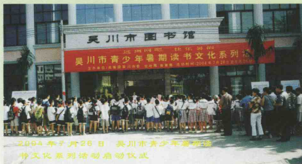
2004年7月26日 吴川市青少年暑期读书文化系列活动启动仪式

吴川市图书馆，原名吴川县图书馆，成立于1982年7月，其前身是县文化馆的图书室。1994年5月，随吴川撤县建市，改为现名。是直属吴川市文化广电新闻出版局的公益性