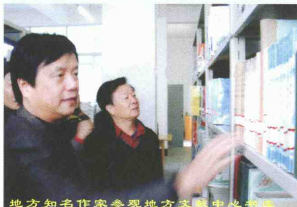
地方知名作家参观地方文献中心书室