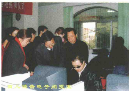
音频语音电子阅览室