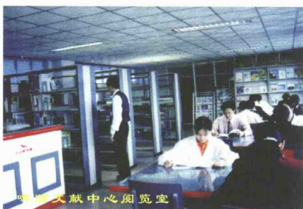
啤酒文献中心阅览室