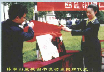
陈家山监狱图书流动点揭牌仪式

不断完善制度,规范管理,提高员工的自身素质和工作绩效:本馆先后荣获市级最佳文明单位、青年文明号、巾帼文明示范岗、女职工双文明示范岗等光荣称号;自1998年开始连续三届被省知识工程领导小组评为先进集体。连续5年被市委宣传部表彰为先进集体。注重业务理论学习,努力提高学术研究水平,仅2005年撰写的论文荣