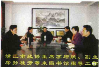
靖江市政协主席苏增跃、副主席孙桂芳等来图书馆指导工作