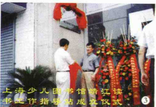
上海少儿图书馆靖江读书工作指导站成立仪式