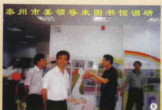
泰州市委领导来图书馆调研