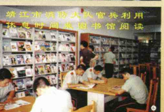
靖江市消防大队官兵利用休息时间来图书馆阅读