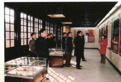
朱东润故居展览室