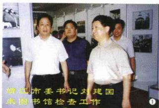
靖江市委书记刘建国来图书馆检查工作

近年来，共收集科技人才读书成果19件，并参加江苏省科技厅、文化厅举办的评选活动，有11项成果获奖，其中一等奖4项；二等奖3项；三等奖4项。从1998年至今，连续四届被江苏省文化厅评为“江苏省文明图书馆”；连续三次被评为