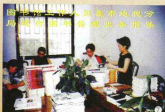
图书馆工作人员在市电教分局接受图书管理业务指导