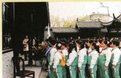
2006.3“读书做人”征文竞赛活动