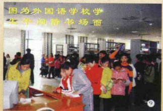
因约外国语学校学生中间借书场面