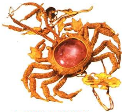
▲ 累丝嵌宝石螃蟹金饰