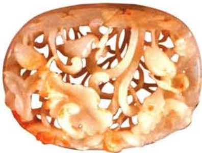
▲ 白玉透雕一路连升饰件

点翠凤冠及点翠首饰是在花丝、镶嵌宝石工艺的基础上，配衬装饰大面积的点翠工艺。点翠，就是将翠鸟的羽毛剪