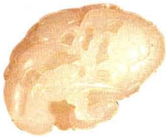
▲ 白玉雕松鹤延年坠