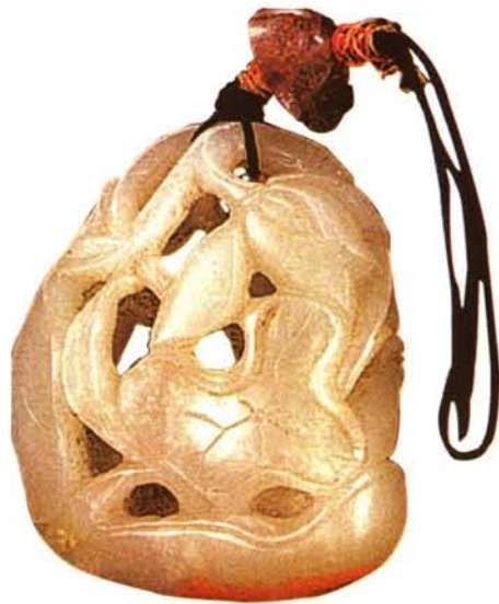
▲ 白玉镂空雕荷花坠