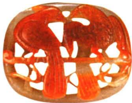
▲ 白玉比翼双飞饰件

元代外族统治阶级俘虏了全国的工匠变为工奴，降低了工人的生产情绪，阻碍了民间手工业的自由经营，工艺上濒