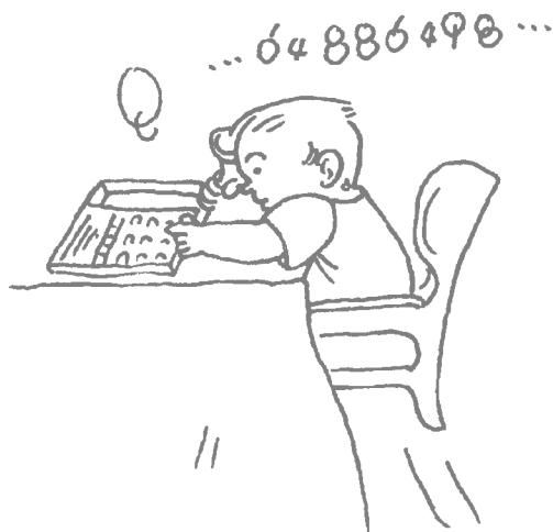
图 1-2 复述数字

复述数字就是顺着背出大人口授的数字，这要求儿童有短暂的注意力和记忆力。1987年，在接受调查的儿童中，有76.2%的30个月儿童能复述两位数，有78.3%的38个月儿童能复述3位数。比内L-M（1972年）量表要求2.5~3岁复述两位数；3~3.5岁复述3位数；7岁复述5位数；10岁复述6位数（比内以70%人能达到的标准规定该年龄能达到的能力）。1995年以后北京许多居民搬入单元楼房，家中都装上电话。大多数两岁半到