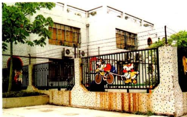
9 幼儿园围墙设计实例之一。