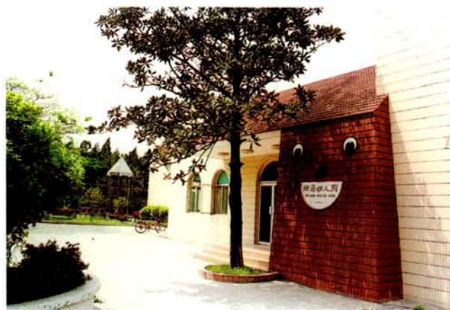
10 用儿童熟悉的圆形、半圆形等几何图形塑造出一个可爱的娃娃脸部形象，“娃娃”笑哈哈的，仿佛在欢迎每一位小朋友，很亲切，有童趣。