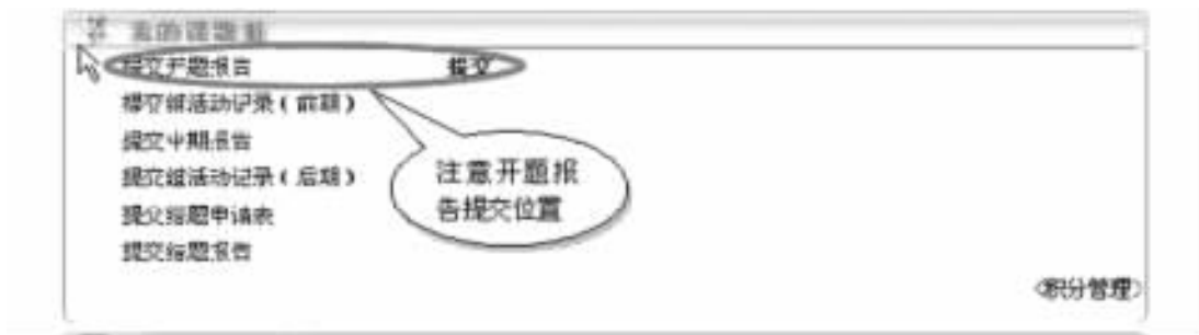
图 员源 摇摇开题报告的提交位置

摇摇(獭提交开题报告。组长提交开题报告是课题进入正式流程的第一步。此报告只能由组长提交。开题报告的填写格式,请参考“在线交流”补充资料二中的相关文档(如图 员源所示)。