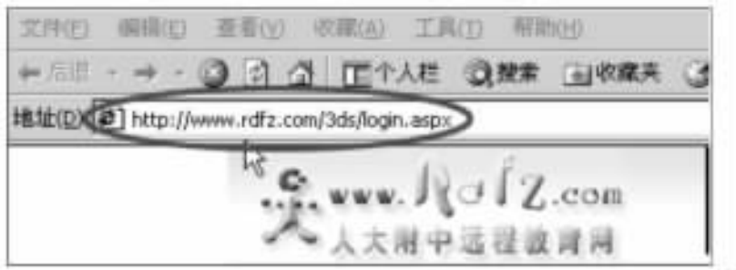
图 5-1 在地址栏中输入

(2) 输入 http://www.rdfz.com/3ds/login.aspx 点击“中学部”进入“人大附中远程教育网”,再点击“人大附中研究性学习网络平台”进入登录界面(如图 5-1 所示)。