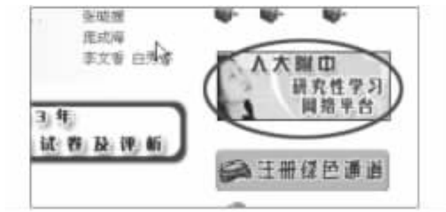
图 5-2 点击图中圈中标注的图标即可进入本系统