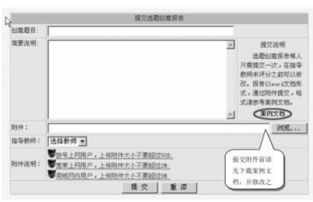
图 员圆 提交选题创意报告的网页

摇摇(员)提交选题创意报告。这是学生要独立完成的一个任务,而且是每个人都必须完成的一步。提交选题创意报告后要等待指导老师对其进行审批,审批通过后,学生便可进行下一步操作。如果不能通过,学生需再一次对自己的选题创意报告进行修改(如图 员圆所示)。