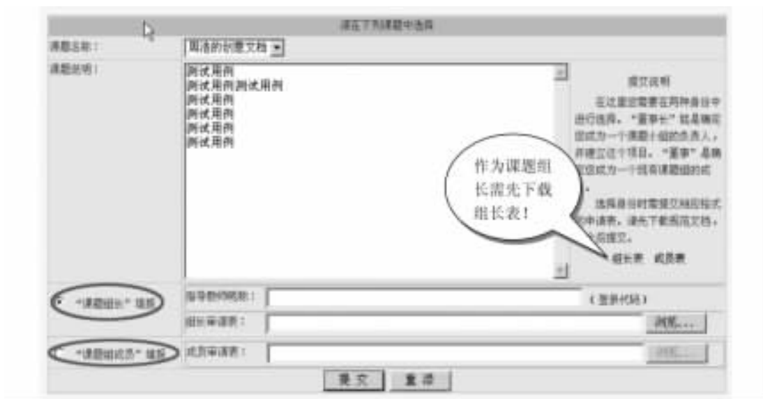
图 员源 摇摇提交选题意向

摇摇(獭提交开题报告。组长提交开题报告是课题进入正式流程的第一步。此报告只能由组长提交。开题报告的填写格式,请参考“在线交流”补充资料二中的相关文档(如图 员源所示)。