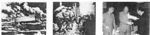
图 K4-1 致远舰冲向敌舰 图 K4-2 中国军队守卫台儿庄 图 K4-3 毛泽东会见日本首相