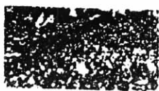
图(d): 上海人民欢庆抗战胜利