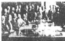
图(a) 屈辱的城下之盟