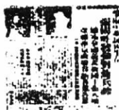
图(b): 报导西安事变的报纸