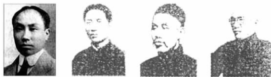
陈独秀 毛泽东 董必武 李达