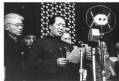
图(b) 中国人民站起来了