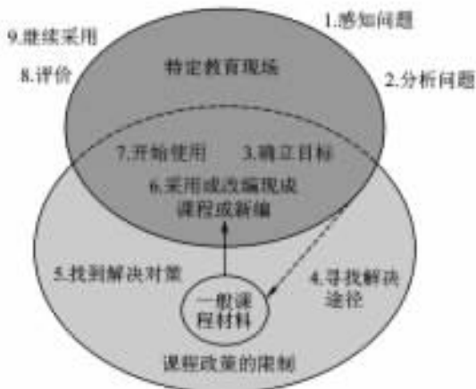
图 1 塞勒等人的校本课程开发程序

发委员会或相关工作小组,承担相关的规划与决策;其次,确立参与课程开发工作的参与成员与开发程序,然后,经由参与成员的集体讨论,拟订课程方向、目标与计划,最后,据此进行课程开发的具体工作。其中,在目标规划部分,需要包含课程类型、课程焦点、时间安排、组织结构等。如果课程成品是详细的教材,则必决定课程主题、教学目标、组织顺序等。整个程序如图 2 所示。