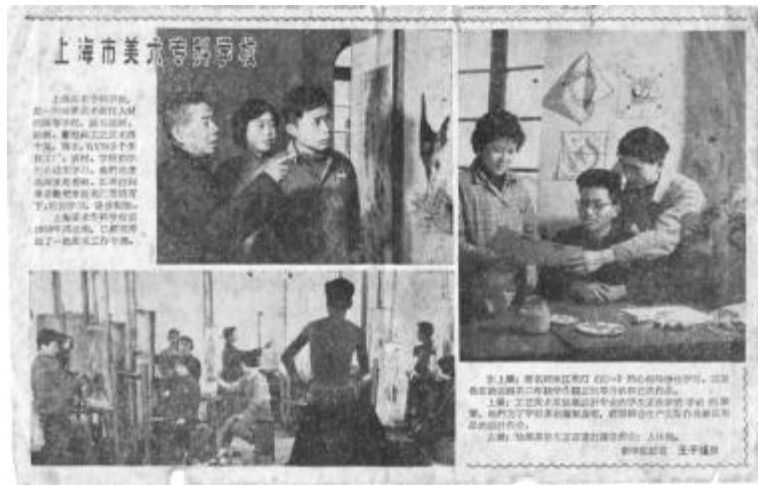
报上刊登由新华社播发的介绍上海市美术专科学校的摄影报道

展览期间,先后邀请家长、美术界、工艺美术界和中学美术教师的代表举行了4次座谈会,同时收到观众意见书155份。观众们在肯定我校成绩的同时,对作品中所反映出来的观察生活、选择题材、处理形象,以及表现手法等方面所存在的问题和缺点,从教学的角度提出了许多建设性的意见和建议。