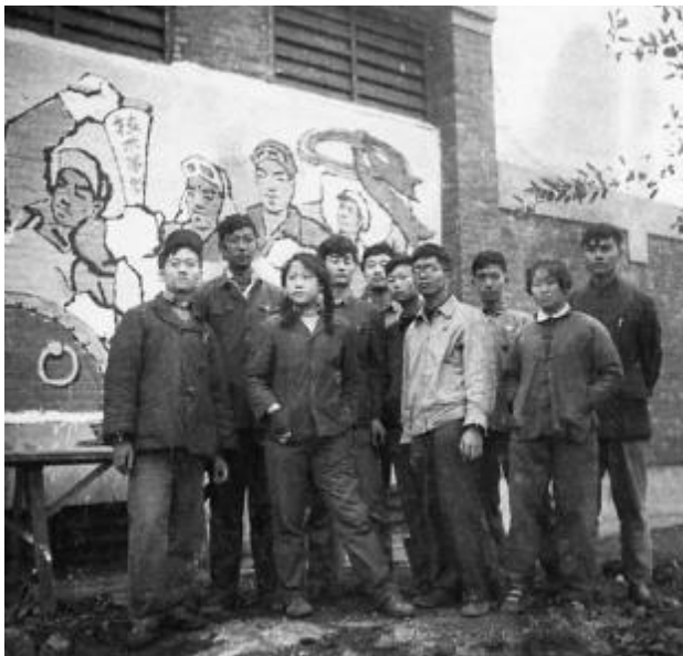
“老中专”同学在壁画前留影

为庆祝上海美术学校校庆两周年,同年3月4日学校举行了庆祝大会。会上沈校长向全体师生发