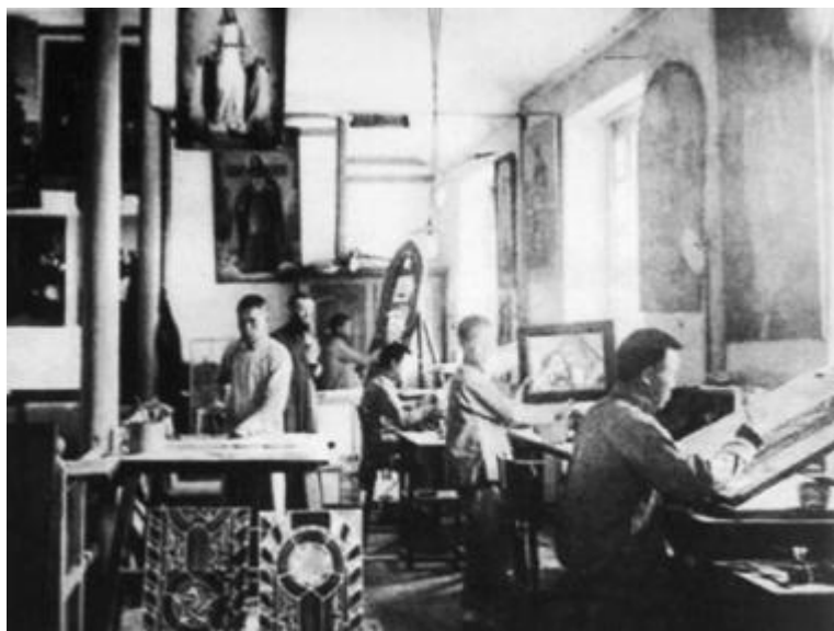
建于 1864 年的徐家汇土山湾圣路加图画馆

由于高等美术教育在上海已经中断了 6 年,一部分师资随着当年美术院校的外迁流向了外地。虽然上海有一批很强的美术力量,但它分布在文化、出版、电影、工艺美术设计等各行各业,有相当部分还分散在社会上,要重建一支高等美术教育的师资队伍,并不是一件轻而易举的事情。作为主管单位的上海市文化局,对重建一所高等美术学院非常慎重。由于人力和师资一时不能调齐,因此,作为尝试和过渡,决定利用正在筹建中的“上海中国画院”人