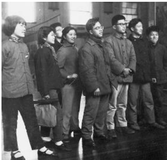
1961年暑假，《第一届教学成绩汇报展览会》在上海美术馆举行。

展览会从8月5日开始，到8月20日结束，共展出16天，参观人数达27610人次。观众们对这个展览给予了较高的评价，认为“展览会洋溢着浓厚的生活气息”，“看到了在美术家的后面，一支庞大的新生力量在迅速成长”。颜文樑先生看了展览后也说：“过去办学几十年，还不易看出成绩，现在仅短短两三年时间便看到学生有这样的水平，这是不容易的。”