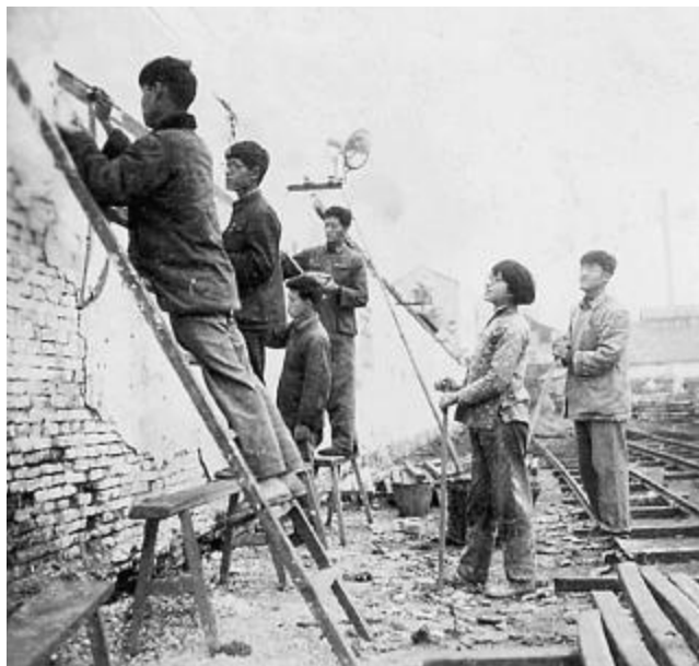
1960年11月,“老中专”同学在上钢二厂劳动期间为工厂画壁画。

在1961年1月14日的全校师生大会上,沈校长作了关于“校风”的专题报告,指出“校风是我们学校的精神面貌的反映,是我们革命意志和学习态度的具体表现”。结合对学校教学工作的具体要求,沈校长指出: