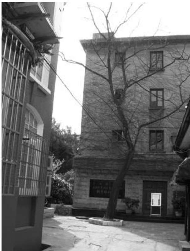
淮海中路1413号内,原上海美校的教学楼