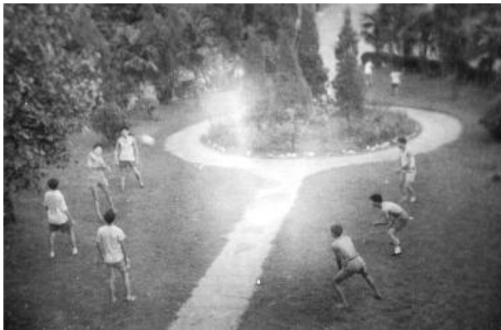
校园内的体育活动

出了“出理论、出作品、出人才”的号召。强调在教师中要健全教研活动，中心是抓好教材建设，提高教材质量；在学生中要提倡艰苦奋斗、勤学苦练、深入生活、搞好创作。