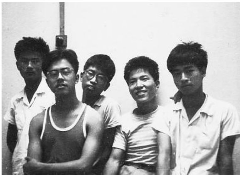
“老中专”部分同学合影