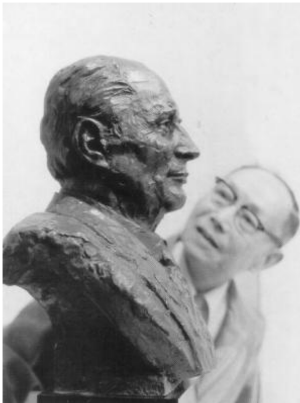
张充仁先生为法国总统密特朗塑像

原定在虹桥路建造新校舍的计划，因文化局决定在原址建造上海市舞蹈学校而作罢。市领导决定将陕西北路500号原共青团上海市团校作为