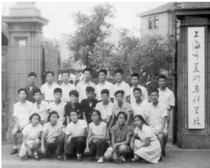
1961年,全校团员在陕西北路500号大门口的合影。