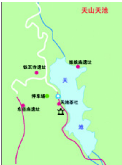
天山天池景区地图

天池是一个天然高山湖泊，海拔1980米，属冰碛湖。据地质工作者介绍：第四纪冰川以来，全球气候有多次剧烈冷暖运动。20万年前，地球第三次气候转冷，冰期来临，天池地区发育了颇为壮观的山谷冰川。冰川挟带着砾石，循山谷缓慢下移，强烈挫磨、刨蚀着冰床，对山谷进行挖掘、雕凿，形成了多种冰蚀地形，天池谷遂成为巨大的冰窖，其冰舌前端则因挤压、消融，融水下泄，所挟带的岩屑巨砾逐渐沉积下来，成为横拦谷地的冰碛巨垅。其后，气候转暖，冰川消退，这里便蓄水成湖。它就是今日的天山天池。