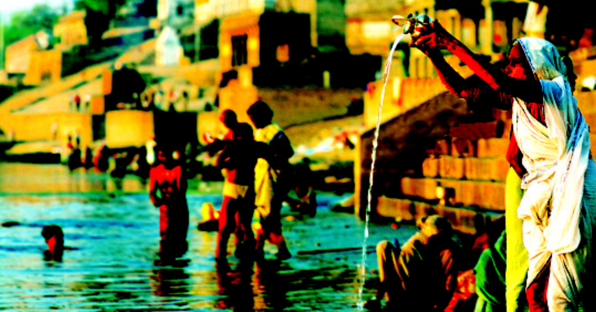
正在恒河里沐浴的印度教徒

仿佛时光倒流了几百年。对岸大片渺无人烟的荒地，与密集的市区和热闹的西河岸形成强烈的对比。