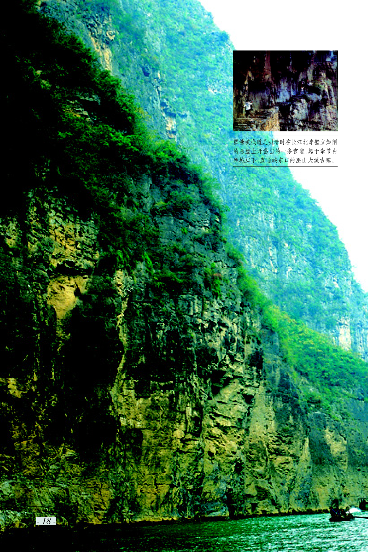
瞿塘峡栈道是明清时在长江北岸壁立如削的悬崖上开凿出的一条官道，起于奉节白帝城脚下，直通峡东口的巫山大溪古镇。