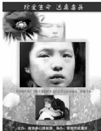
珍爱生命 远离毒品

一位形象不错的姑娘，曾经在邮电局工作，还有个很喜欢她的男朋友，可以说事业爱情双得意。可自从男友在一场车祸中丧生后，她便失去了对生活的热忱，失去了生命的支柱。从此便以毒品来麻醉自己，在吞云吐雾中