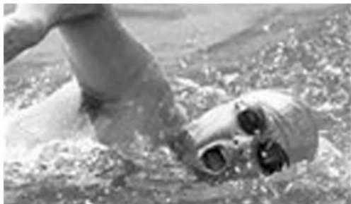
别放弃,陆地就在前面!

当你一旦确立了自己的人生目标,就要有实现这一人生目标的坚定信念。何为信念?信念就是相信自己,相信胜利,相信自己所确定的目标,相信自己为达到这一目标所具备的能力。信念好比航标灯射出的明亮的光芒,在烟波浩渺的人生海洋中,指引着人们走向辉煌。高高举起信念之旗的人,对一切艰难困苦都无所畏惧。相反,信念大旗倒下了,人的精神也就垮了下来,而从来就不曾拥有过信念的人,对一切都会畏首畏尾,在漫无边际的人生旅途中抬不起头,挺不起胸,迈不开步,整天浑浑噩噩,看不到光明,因而也感受不到人生的幸福快乐。