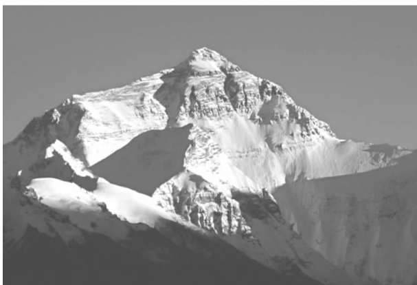
世界最高峰——珠穆朗玛峰

还有那么一部分人并不满足现在已经取得的成就,他们不但成为群体的领导,赢得了大家的信赖,而且还要再接再厉,不计个人得失,尽量地发挥