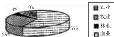
图2 1999年我国农业产值构成示意图