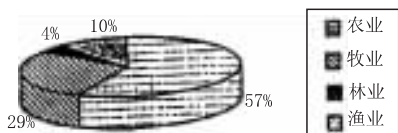
图2 1999年我国农业产值构成示意

(5)2001年1月,中央农村工作会议提出,进入新世纪,要进一步巩固和加强农业的基础地