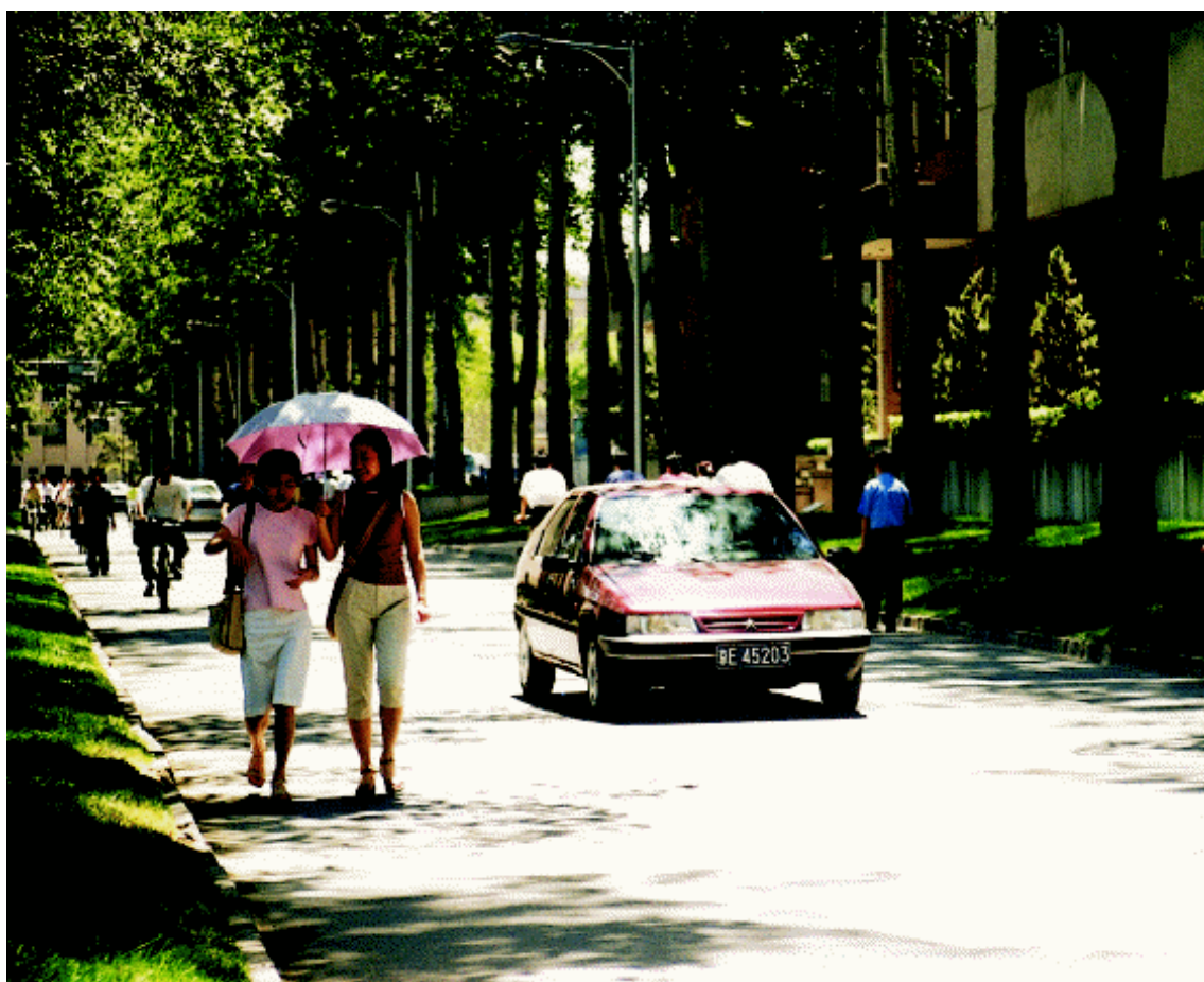
清华的一处街景。清华的学生走路的步速是相当快的，总显得匆匆忙忙。不过也难怪，这么繁重的学业，那还不得疲于奔命？

西门一进来，就是一条大路，一直绵延几千米看不到尽头，宽敞到不像是校园中的干道，而是像一条小马路，车辆来来往往，穿梭个不停，即使是在早上。路上隔不多远，就有一道特设