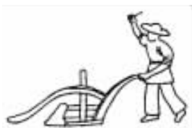
图1 敦煌壁画中的犁