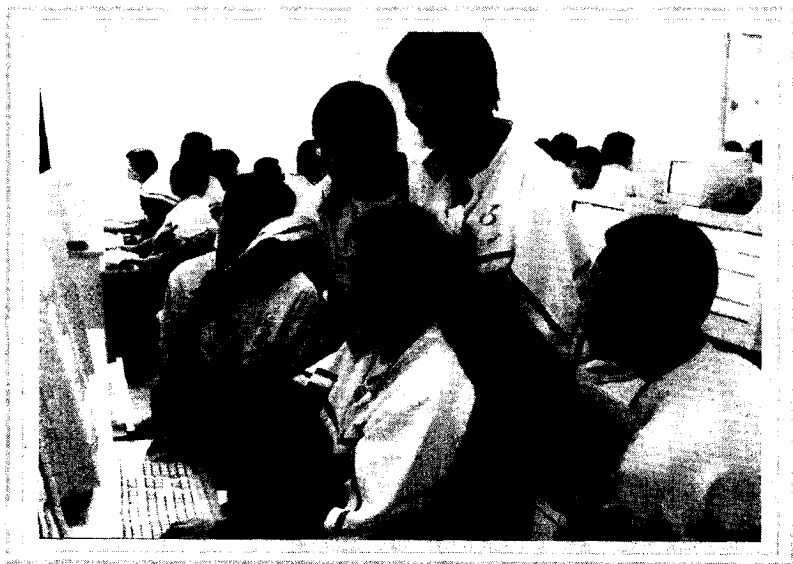
北京市昌平一中学生通过网络了解历史、走进世界

特征催生青少年的现代观念。它使青少年不断接触新事物新技术 接受新观念的挑战 为青少年形成全球意识 拓宽青少年的求知途径起到了积极的作用。大量事实证明 青少年接触网络不应该被认为是一件可怕的事情 相反不知 Internet 为何物倒是令人不安的。有统计说明 我国因特网使用者在城市青少年中比例大大高于农村青年 而且男性大大高于女性。我国上网人数虽已突破 6000 万 但大专以上学历的占一半多。由于欠发达地区信息技术的落后 经济贫困 青少年较少上网 由于网络生活的差异 将会引发青少年社会化进程的的巨大差异。面对网络化趋势的迅猛发展 学校德育的首要目标是引导学生主动驾驭网络这一强大的物质武器 形成熟练的网络生活的实践能力。德育创新 走进网络, 是时代赋予我们的重大历史使命。