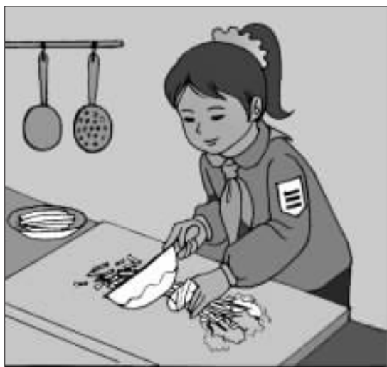
切菜刀碰破手也不怕