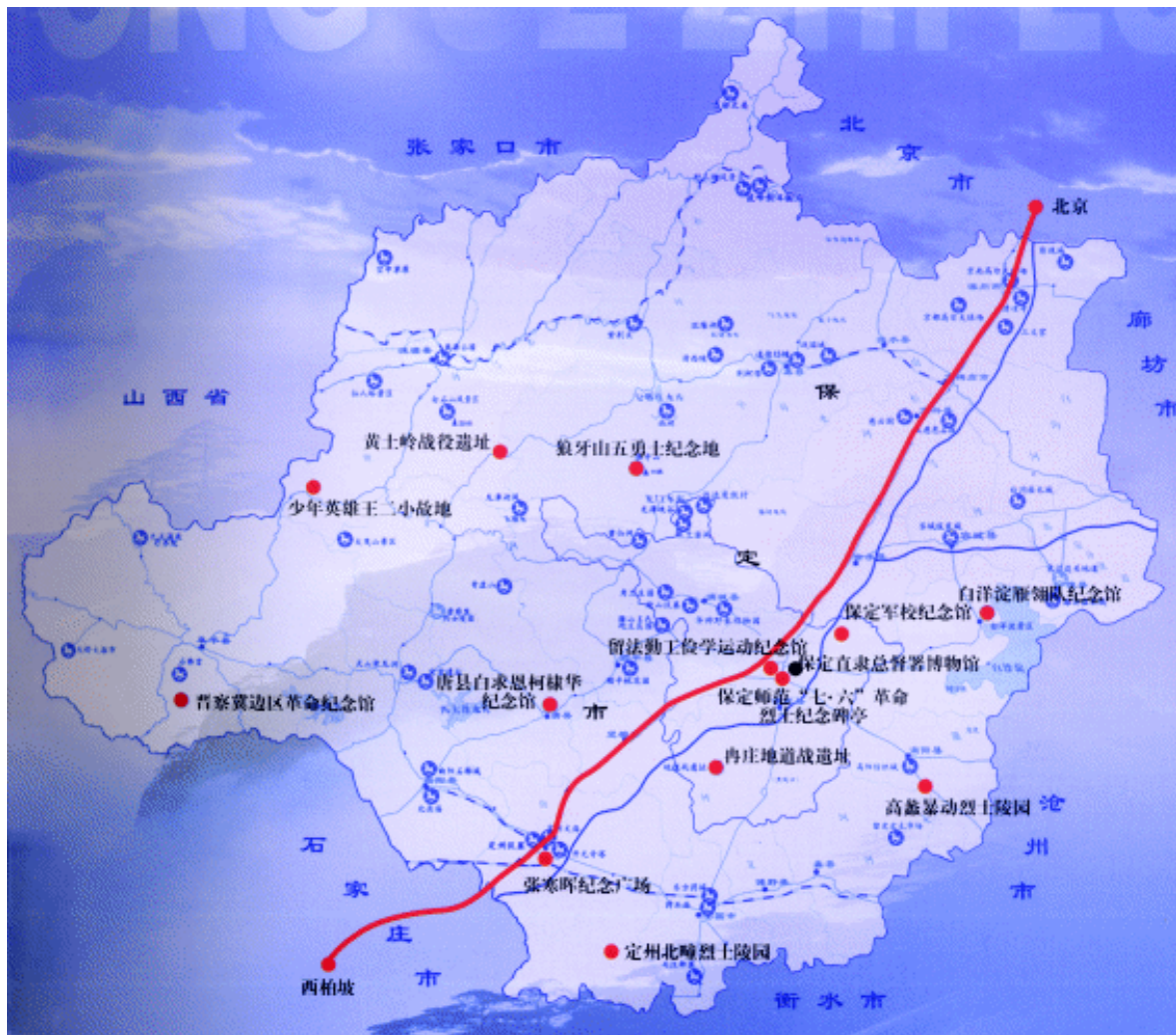
保定红色旅游景点示意图

山，长大后建立了唐尧部落。春秋时期，保定被燕、中山、赵等诸侯国所割据。燕昭王中兴，置黄金台以揽天下贤臣，位于易县的燕下都遗址便是这一时期的见证。燕义士荆轲携一匕首，只身入虎狼之秦，几千年来的易水之畔，仿佛仍回响着“风萧萧兮易水寒，壮士一去兮不复还”的悲壮歌声。汉高祖刘邦斩白蛇一统天下，曾对当时的曲逆县城（今顺平县）赞叹不已，认为天下各地只有洛阳可与它媲美，便把它封给功臣陈平。保定西侧的满城县有一座汉代古墓，埋葬着汉武帝刘彻的庶兄中山靖王刘胜。1968年，这里因出土了金缕玉衣、错金博山炉、长信宫灯等一大批精美文物而使全世界为之震惊。东汉末年，