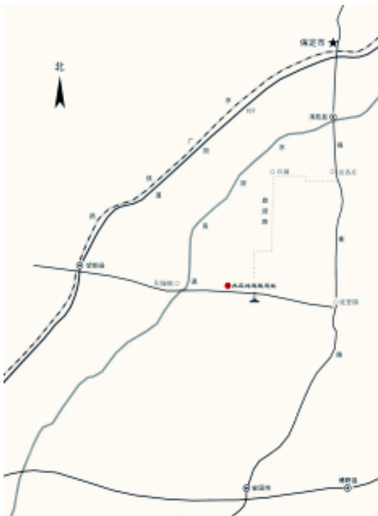
冉庄地道战遗址旅游交通图

古兵入侵中原，屠杀全城军民，毁为废墟。自元代之后，清苑即为河北一带的政治中心，是省、府治所。民国初年（1912年）留府裁县，次年废府治复县治。1941年，为纪念在抗战中病逝的中共冀中区委社会部部长李之光，表彰他在清苑的杰出贡献，命名清苑东路为之光县。清苑以张（登）保（定）公路为界分为清苑、之光两县。1944年两县合并，初称之光，后称清苑。1952年10月，清苑县治所由省城保定迁至南大冉村。可以说，清苑的历史就是保定的历史。