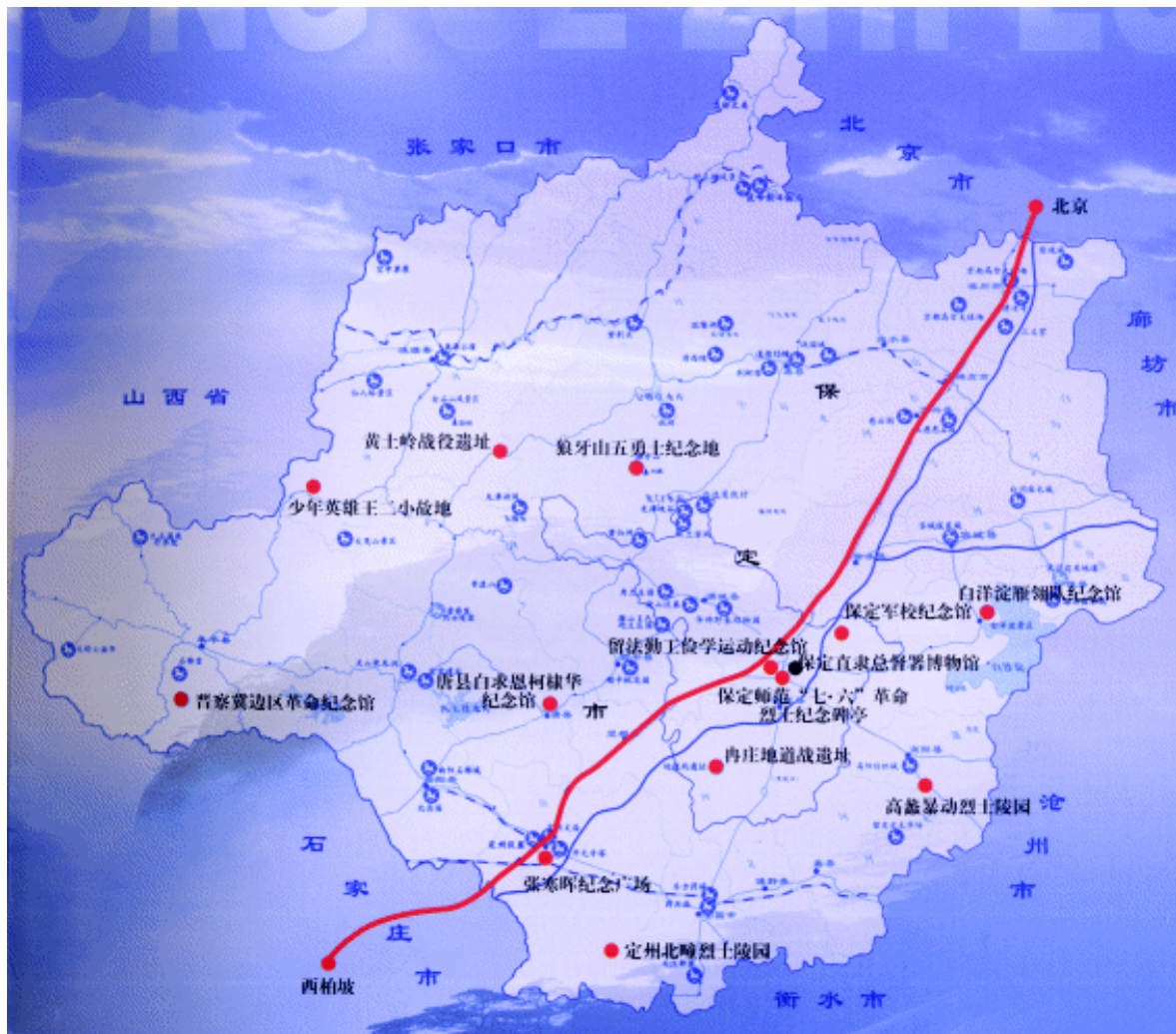
保定红色旅游景点示意图

山，长大后建立了唐尧部落。春秋时期，保定被燕、中山、赵等诸侯国所割据。燕昭王中兴，置黄金台以揽天下贤臣，位于易县的燕下都遗址便是这一时期的见证。燕义士荆轲携一匕首，只身入虎狼之秦，几千年来的易水之畔，仿佛仍回响着“风萧萧兮易水寒，壮士一去兮不复还”的悲壮歌声。汉高祖刘邦斩白蛇一统天下，曾对当时的曲逆县城（今顺平县）赞叹不已，认为天下各地只有洛阳可与它媲美，便把它封给功臣陈平。保定西侧的满城县有一座汉代古墓，埋葬着汉武帝刘彻的庶兄中山靖王刘胜。1968年，这里因出土了金缕玉衣、错金博山炉、长信宫灯等一大批精美文物而使全世界为之震惊。东汉末年，