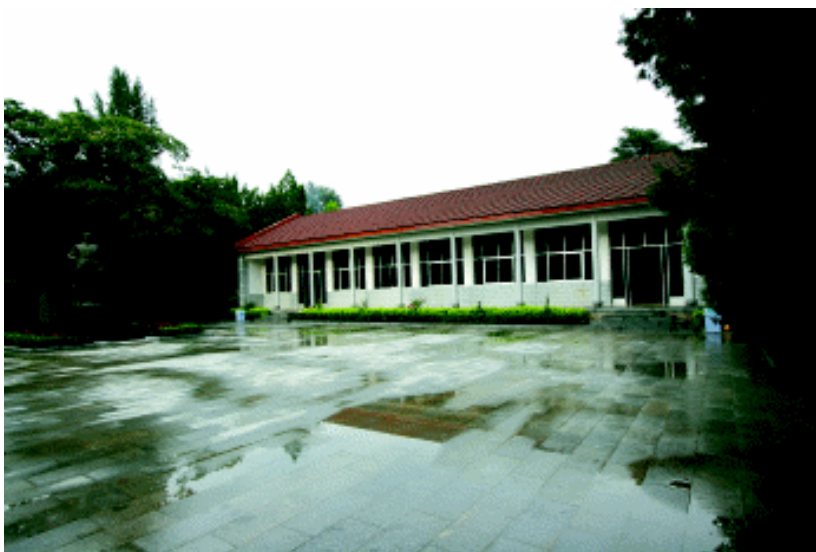
阜平城南庄革命纪念馆

阜平旅游资源丰富，既有风光秀美的自然资源，又有历史文化、现代革命纪念地等人文资源。自然资源中有山势险峻、奇峰林立、云海茫茫、巍峨挺拔的古北岳恒山大茂山（也称神仙山），华北暗河金龙洞，万亩松涛仙人山，以玫瑰遍野、怒放争艳而闻名的玫瑰坨。还有水温 80℃，既能驻容养颜、又能