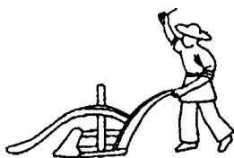
图 1 敦煌壁画中的犁