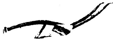
图 4-2 18 世纪晚期欧洲的新式犁

①图 4-1 的犁称曲辕犁, 早在中国汉代就已经应用了 ②图 4-1 和图 4-2 相比表