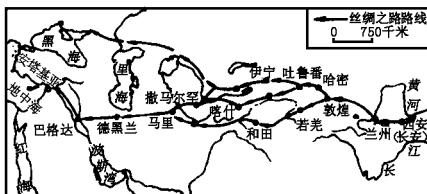
图 4-3 丝绸之路示意图

25.（'02 全国文综）历史上的“丝绸之路”是中外经济、文化交流的重要通道，今天的“亚欧大陆桥”被誉为“现代丝绸之路”。读图 4-3 回答：