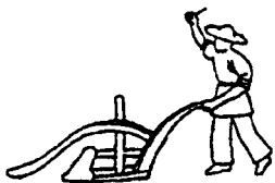
图 4-1 敦煌壁画中的犁