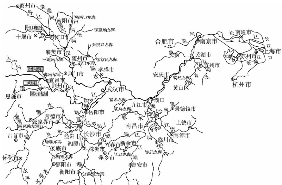
图 员原 员 长江中下游湖河水系结构图

长江中下游水系结构的显著特点是，许许多多的河流流入一个个湖泊，然后再汇入长江干流。其左岸的主要支流黄柏河、江汉湖群水系、安徽江北自然堤后湖水系、与人为活动有关的洪泽湖 原邵伯湖水系等，南岸的主要支流有洞庭湖水系、鄱阳湖水系、石臼湖水系与太湖水系等（图 员原 员）。