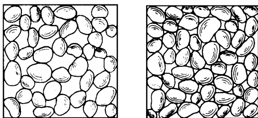
图 1-3 土的单粒结构

单粒结构可以是疏松的,也可以是紧密的(图 1-3)。呈紧密状态单粒结构的土,由于其土粒排列紧密,在动、静荷载作用下都不会产生较大的沉降,所以强度较大,压缩性较小,一般是良好的天然地基。具有疏松单粒结构的土,其骨架是不稳定的,当受到震动及其他外力作用时,土粒易发生移动,土中孔隙减少,引起土的很大变形。因此,这种土层如未经处理一般不宜作为建筑物的地基或路基。