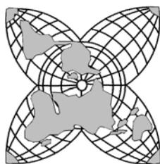
图 1-1 大陆星