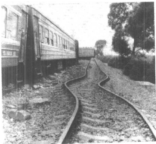
地震时铁轨蛇形弯曲

站，正以每小时 90 公里的速度奔驰。突然，漆黑的夜空闪过三道耀眼的光束，掠空而过，转瞬即逝，并在夜空中留下三朵蘑菇状烟雾。司机意识到将发生地震，当机立断，拉了非常制动闸，并机敏地控制机车，使剧烈摇晃颠簸的列车慢慢地停下来，避免了伤亡。地震对公路的破坏占唐山公路总里程的 80% 桥梁破坏占 62%。地震造成的公路路面开裂和断陷，裂缝最宽达 1 米，垂直落差达 1.6 米；唐山市东出口的胜利桥是一座长约 66 米、宽 10 米的五孔水泥桥，4 座桥墩，每座由 3 根直径为 1.5 米的钢筋混凝土柱组成，地震后桥墩折断、桥面塌落；滦县的滦河大桥全长 789 米，7.8 级地震遭受严重破坏但尚可通车，下午发生在滦县的 7.1 级地震后，桥墩折断，23 孔桥面落梁。