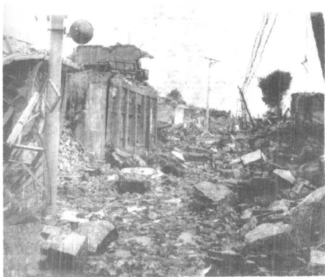
繁华的小山商业街震后一片瓦砾

1311 万平方米，破坏率达 95.8%。居民住宅的破坏更为严重，破坏率达到 97.25%。昨日的唐山就这样坍塌成了一片砖头瓦砾、断壁残垣。这是一场举世震撼的灾难！