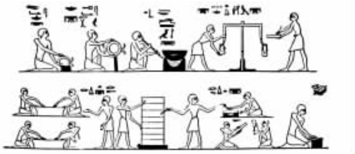
图 2 埃及的金匠洗涤、熔化和称量黄金。本尼·哈桑,公元前 1500 年。

铁、银和铅等金属。早期的铁很罕见,可能是从外层空间落到地球上的陨石得到的(因为它含镍)。这种前王朝时期的铁,可以和青金石的念珠串在一起,用来做珠宝装饰品上的珠子。彼特立曾在前王朝的墓