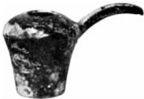
图 缘 瑶 古代埃及铜皿,发现于阿贝都斯 ( 图 缘 瑶 ) [据埃万斯( 图 缘 瑶 )著的《克诺萨斯 的米诺斯王宫》( 图 缘 瑶 )]

迈西尼文化是在开始用铁之前,到了希腊古典时期,才开始用铁。铁的使用是随着新的民族对米诺斯文化的破坏而流行起来的。