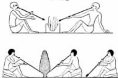
图 1 埃及的金属加工。上图:用芦管吹火,芦管头用黏土糊上;本尼·哈桑,公元前 1500 年。下图:制造铜瓶,底比斯,大约公元前 1500 年。

知道青铜和黄金之后不久,在前王朝时期[即在美尼斯王(孟菲斯)之前,大约公元前 3500 年] ② ,埃及人也知道了