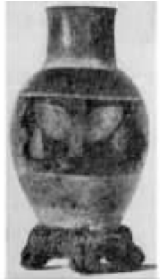
图 缘所示为公元前 猿年左右的古埃及铜皿,图 远示为稍后期的一些最早的金属物件,其中有一块铁。图 苑示为铅制的古代小雕像。在早期苏美尔的遗址上也发现过少量铁。

在古老的米诺斯文明中心——克里特岛上的克诺萨斯及其他遗址的遗物中也发现过铜。这种铜的年代可追溯到公元前 猿年,可能来自塞浦路斯岛。克里特人大概是从和他们自古就有来往的埃及人那里学会使用金属的。图 愿所示的在瓦弗(又译作)出土的漂亮的金杯,被认