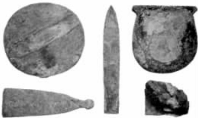
图 缘 瑶 铜镜、铜制工具和(右下角)在阿贝都斯发现的一块铁 (公元前 缘 瑶 缘 瑶 年)(大英博物馆)

有一种和迈西尼文化不同的文化,它可能经过巴尔干北部扩展到多瑙河盆地和匈牙利,特洛伊是这种文化的前哨。“第二城” ① (公元前 缘 瑶 缘 瑶 年)的青铜含锡量达到 缘 瑶 。