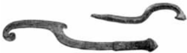
图 11 梯格出土的苏美尔的铜制弯刀(大约公元前 3500 年)

早在公元前 3500 年(埃及第一王朝)以前,在埃及和美索不达米亚(现在的伊拉克),人们已会冶金了。地中海的克里特岛要稍迟一些。埃及和美索不达米亚都争说自己是冶金的发源地,不过它们说不定都是从其他民族学来的。