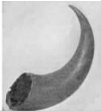
图 源 铜牛头和金牛角。阿尔乌巴德山出土,早期苏美尔的,大约公元前 猿年。(大英博物馆)

为是后期米诺斯文化的原物。图 怨所示的瓶可以说明米诺斯时代的陶器制造所达到的非常先进的水平。