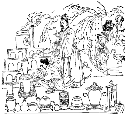
图圆 中国古代炼丹图

在生产和生活的实践中,人们明确地认识到,某些物质是可以改变的。例如,黏土变成了陶器,矿物变成了金属。在获取更多的黄金、白银和长生不老仙丹的愿望驱动下,在古代的中国、希腊、阿拉伯及欧洲先后兴起了金丹术(炼金术)。在当时的科学水平和技术条件下,变贱金属为黄金一类贵金属是不可能的,炼制得到长生不老的仙丹更是异想天开。然而,在长期的炼金、炼丹(图圆)活动中,人们开始进行原始的科学实验活动,认识了许多物质和它们的许多变化,并设计制造了加热炉、反应室、研磨器、蒸馏器等实验用具。金丹术士们的追求虽属荒诞,但其采用的器具、方法和积累的化学知识却成为近代化学的先导。特别值得一提的是中国金丹术士们在实验中发现的黑火药配方,当它被应用于军事并