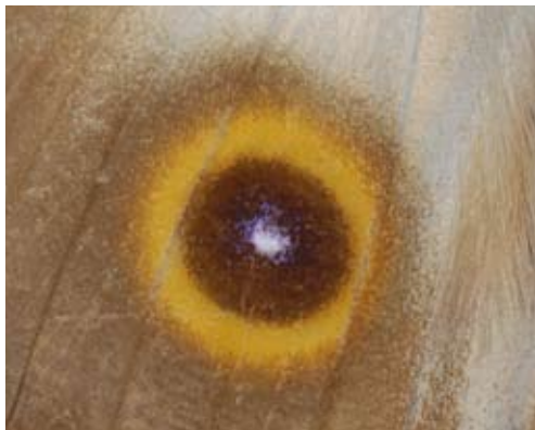
眼斑的结构在不同的蝴蝶中结构不一样，这是其中的一种：黑色的眼斑内具白色的瞳点，外面具黄色的眼眶

眼斑可能还有种内的通讯作用，特别在性选择上。按作用可把眼斑分为两种类型：一类只对其它种起作用，而另一类在种内起作用。有些蝴蝶，不同个体翅上的眼斑变异很大，从没有眼斑到后翅外缘具一排眼斑，眼斑的位置也有很大差异，同时雌雄两性在眼斑上也有差异。有研究表明，有些蝶种在两性选择中起作用的是眼斑中央白色“瞳点”反射紫外线能力的大小。如果在“瞳点”上涂上能吸收紫外线