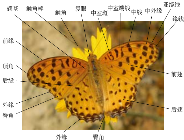
以斐豹蛱蝶 ( Argyreus hyperbius ) 为例的翅模式图

这里需要指出的是，弄蝶科比较特殊，它们身体粗壮，颜色灰暗，与大多数蛾类相近。但从触角端部膨大或尖锐，呈钩形以及白天活动，可与蛾类区分。