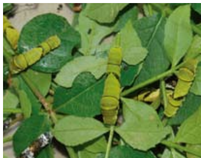
用花椒叶饲养的柑橘凤蝶 ( Papilio xuthus )