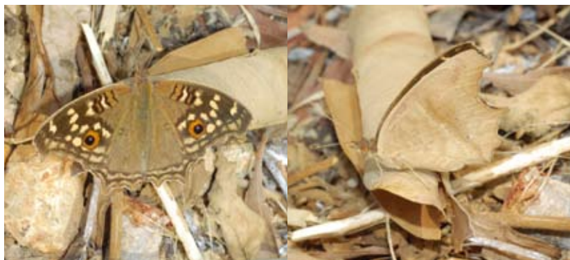
蛇眼蛱蝶（ Junonia lemonias ）翅正反面的斑纹完全不同，当翅竖在背面时，与地面枯叶的背景一致，很难被观察到

一些蝴蝶的幼虫从取食的植物中，可有效地利用植物体内的毒素，作为幼虫及羽化后成虫的防御素材，防止天敌的捕食。对于这种蝴蝶来说，要在天敌捕食前，明确地告诉天敌它们有毒。如果没有提前警告的话，被天敌捕食后，虽然是不可食的，但对这只蝴蝶来说，可能已命丧黄泉了。因此提前警告具有重要意义。也有的身体无毒素，但翅反面的斑纹对天敌起到错位的影响（如眼斑）。