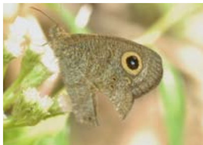
一种矍眼蝶 ( Ypthima sp.), 它的后翅具一个楔形缺刻，可能被鸟啄过