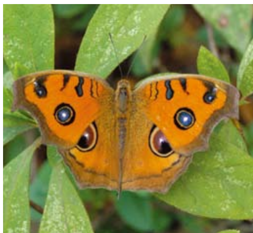
美眼蛱蝶 ( Junonia almana ) 前后翅具多个眼斑，其中后翅的眼斑更大，张开后翅时更是显而易见

对于许多动物来说，眼睛是重要的视觉信号。人们看一种动物时，常常先看它的眼睛。有些动物也避免同种之间眼睛的对视，或碰到同种眼睛时会闭上自己的眼睛。这或许能解释一些天敌见到眼斑后的反应。一些幼虫的眼斑结构很特殊，不论从什么方向看它，它总是在凝视着我们。面对这样“虎视眈眈”的眼睛，猎食者是否也会不敢下手？