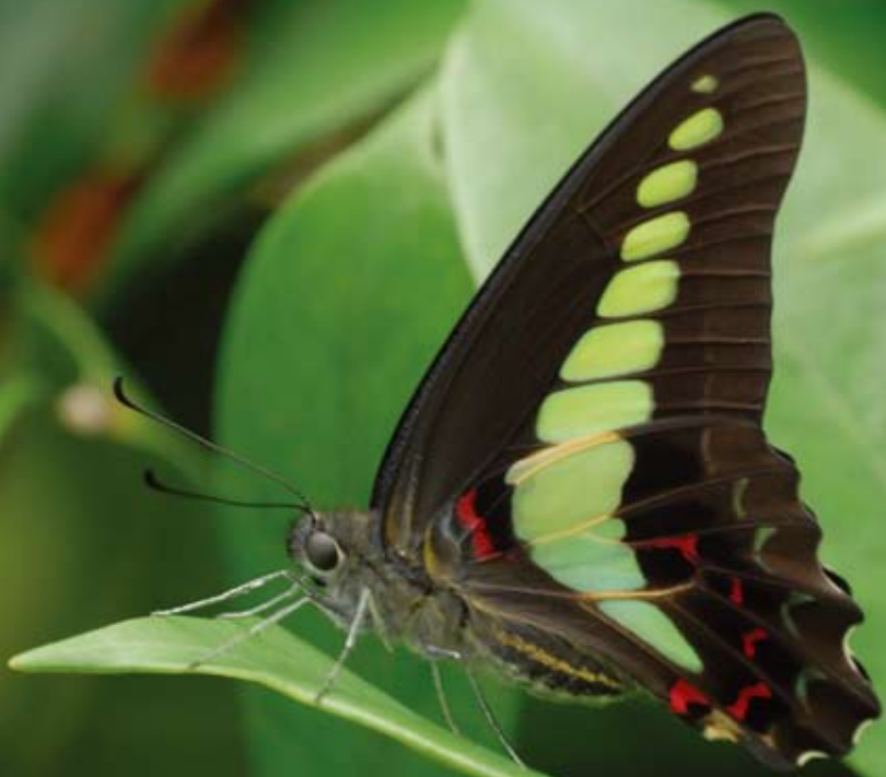
正在休息中的青凤蝶 ( Graphium sarpedon )