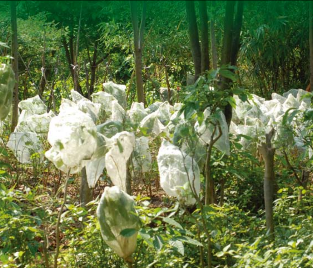
野外用网笼罩饲养蝴蝶幼虫