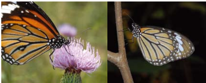
虎斑蝶 ( Danaus genutia ) 后翅反面具一个明显的性标，即雄蝶后翅中后部具一黑褐色香鳞分布区 (左)，而雌蝶则没有 (右)

但还有一些蝴蝶，外形大致相近，翅膀上的某些结构或斑纹稍不同，这就是所谓的性标，雌雄间借此识别是否是异性伴侣。如一些豹蛱蝶，雄蝶前翅近后缘的1~4条脉纹变粗，而雌蝶保持原样。有些雄蝶在前翅或后翅具有一些特殊的鳞片，称之为香鳞。这些鳞片，基部与腺体相连，腺体可产生性信息素。当雄蝶接近雌蝶进行飞舞时，腺体分泌性信息素，通过雄蝶翅膀缓慢的拍动而释放。而