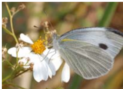
蝴蝶的触角端部膨大，呈棒状；2对翅膀竖在身体的上方，有时平翅。这是东方菜粉蝶（ Pieris canidia ）

此外，蝶类与蛾类飞行时前后翅的连接方式也不一样。蝶类的后翅基部前缘膨大，飞行时搭在前翅基部，起到联动作用。大多数蛾类的后翅具一翅缰，即一根针状的结构，飞行时插入前翅特定结构中，这样飞行时前后翅可一起联动。