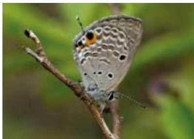
曲纹紫灰蝶 ( Chilades pandava ) 的后翅后缘具一对眼状斑，此外还有一对细长的尾突，看上去像是头部所在