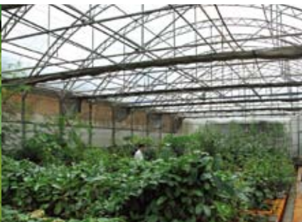
高大的网室适于蝴蝶的婚飞，收集产下的卵用于人工饲养